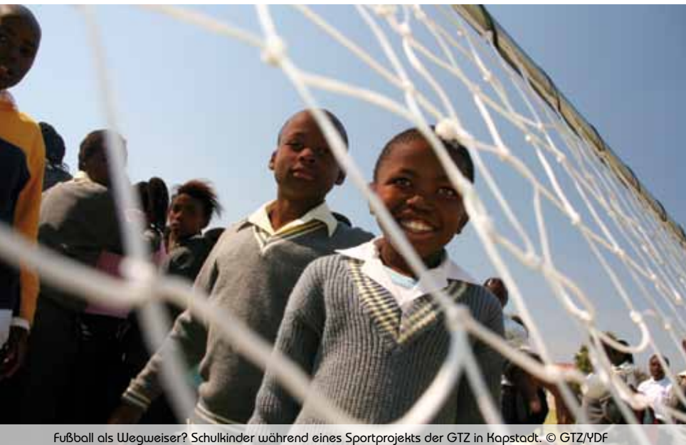
Fußball als Wegweiser? Schulkinder während eines Sportprojekts der GTZ in Kapstadt.

schulden sie innerhalb kurzer Zeit. All diese Maßnahmen brachten Fachkräfte hervor, von denen Südafrika auch langfristig profitieren dürfte. Die anstehende Fußballweltmeisterschaft konnte negative Auswirkungen der weltweiten Wirtschafts- und Finanzkrise etwas abfedern. Die WM hat viele ausländische Investoren, darunter auch deutsche Unternehmen, nach Südafrika gebracht. Es bleibt zu hoffen, dass dies ein dauerhafter Effekt ist.