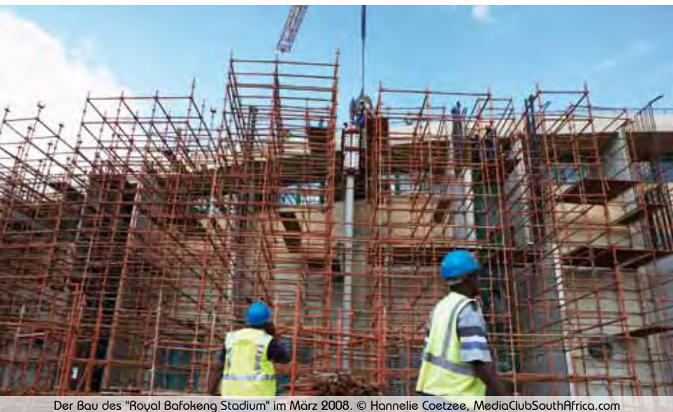
Der Bau des "Royal Bafokeng Stadium" im März 2008.

Darüberhinaus sind die Investitionsausgaben für die veranstaltungsbedingte Infrastruktur zu nennen (Rahmann et al., 1998). Diese muss durch Kreditaufnahme oder Umverteilungen finanziert werden. Sie kann, sofern diese Struktur nachgefragt wird, langfristige Standortvorteile für einzelne Branchen bringen, ist aber direkt häufig weniger produktiv als ein Industriepark.