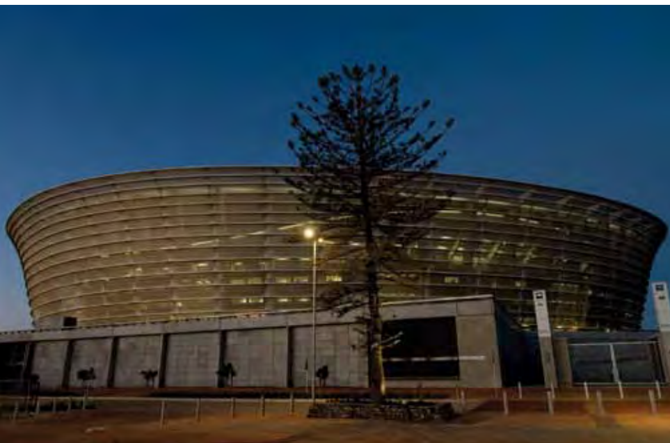
Mensch gegen Umwelt? Das Cape Town Stadium in der Western Cape Provinz.

zung ineffizienter und umweltverschmutzender Privatfahrzeuge. Als zweitgrößter Umweltfaktor nach dem Transportwesen gelten die im Hotel- und Gastronomiegewerbe während der Veranstaltung eingesetzten Ressourcen. Die Planung und der Bau von Stadien sind weitere Faktoren. Wenn man bei der Gestaltung des Stadions Aspekte der Energieeffizienz berücksichtigt und eine sorgsame Materialauswahl vornimmt, kann dies die Umweltverträglichkeit des Gebäudes deutlich aufwerten – gerade in Hinblick auf das künftige Potential der Ressourceneinsparung.