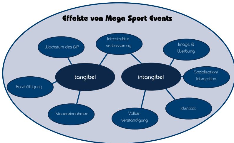
Abb. 1: Ausgewählte sozio-ökonomische Effekte von Mega Sport Events

Die FIFA Fußball-Weltmeisterschaft 2006™ in Deutschland wurde in ökonomischer Hinsicht vom Autor intensiv erforscht (Preuss, Kurscheidt & Schütte, 2009). Bei dieser Untersuchung wurde die wirtschaftliche Wirkung durch den Konsum der – vornehmlich auswärtigen – Besucher der Fußball-WM 2006 in Deutschland auf Grundlage von Zuschauerbefragungen (also „bottom-up“) berechnet. Dazu wurden N=9.456 Besucher in elf WM-Städten vor und im Stadion, bei 15 Fan-Festen und in zehn methodisch bedeutsamen Kontrollgruppen befragt. Dabei wurde