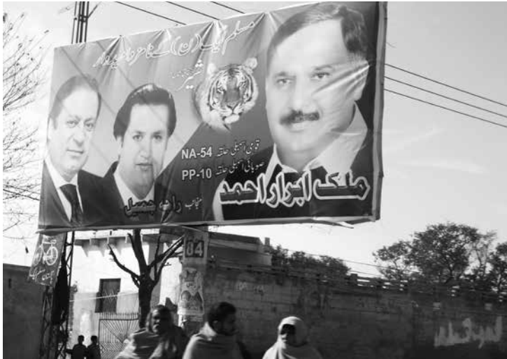
Wahlplakat der PML-N: Die Partei hat mit 125 von 272 Sitzen gegenüber 2008 deutlich zugelegt.

zu einem Vorteil. 20 Zugleich verspricht der Paschtune Khan, der dem Stamm der Niazi angehört, einen neuen Ansatz für die Lösung der Gewalt- und Terrorprobleme im Nordwesten und kritisiert medien- und massenwirksam den amerikanischen Drohnenkrieg. Nach einem folgenschweren Sturz im Wahlkampf muss Imran Khan den Urnengang jedoch schwerverletzt vom Krankenbett aus verfolgen.