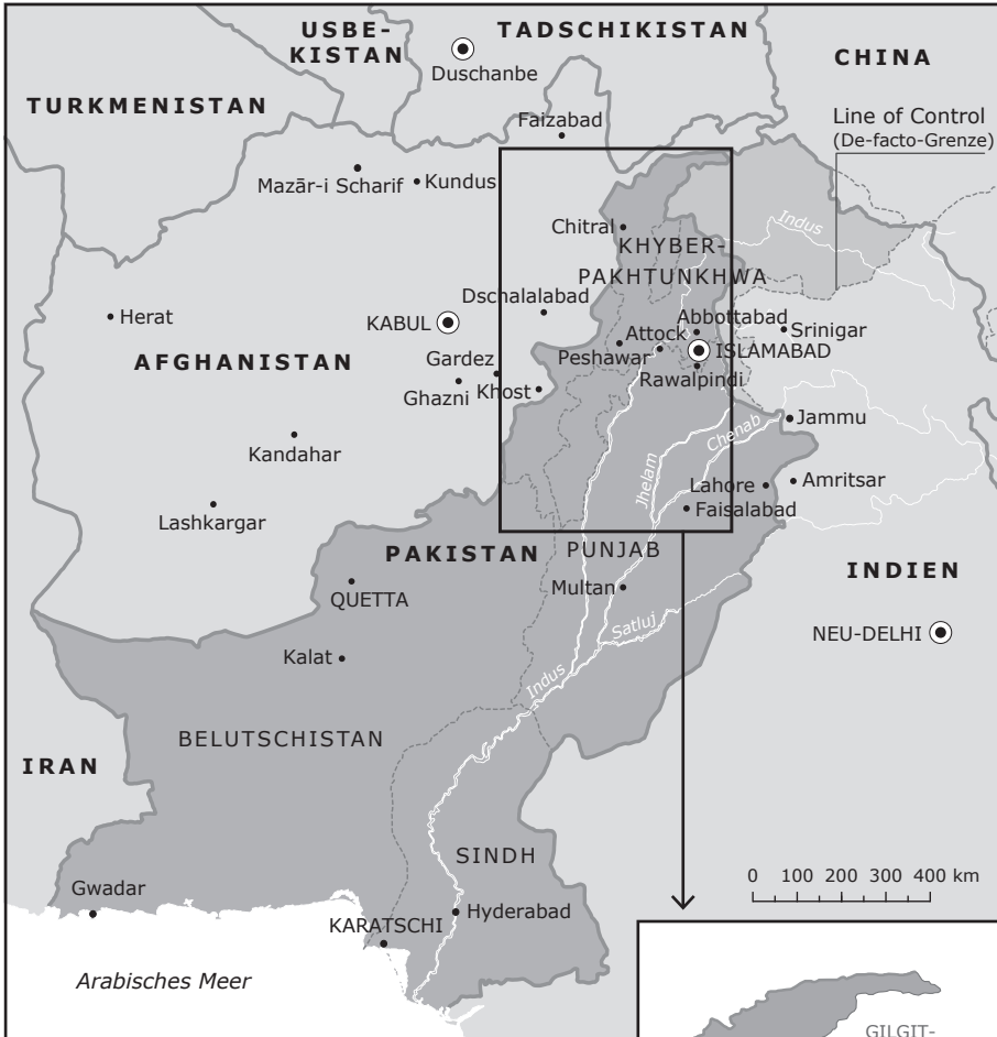
Abb. 1 Pakistan