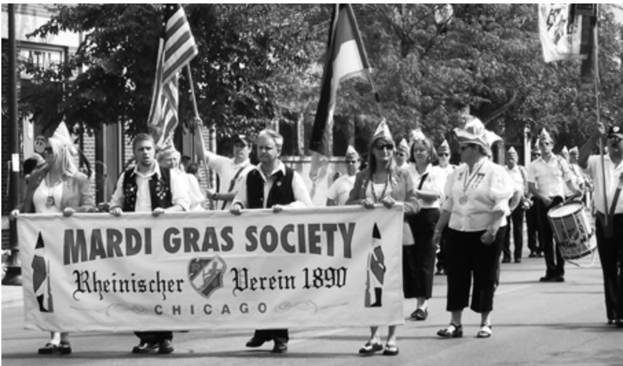
Die Mardi Gras Society Rheinischer Verein in Chicago: Das deutsch-amerikanische Kulturgut hat viel von seiner früheren Bedeutung eingebüßt.

Kultur. 3 Während des Ersten Weltkriegs wurde die deutsche Sprache verboten und die Kultur verdrängt. Dies konnte jedoch die Nostalgie der Deutschamerikaner für das Land ihrer Vorfahren nicht dauerhaft unterdrücken. Nach dem Krieg wurden Hunderttausende amerikanischer Soldaten in Deutschland stationiert. Sie lernten die deutsche Kultur kennen, bauten Beziehungen zu Deutschen auf und bildeten in der Vorstellung der Amerikaner ein wesentliches Bindeglied zwischen den beiden Ländern. Diese Soldaten und Amerikaner deutscher Herkunft bereiteten den Boden für das Interesse an der deutschen Sprache in den Vereinigten Staaten. Amerikanische Geschäftsleute und Touristen reisten nach Deutschland und umgekehrt.