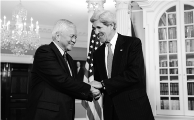
Der Außenminister der Philippinen del Rosario mit US-Außenminister John Kerry 2013: Aufgrund Amerikas Orientierung nach Asien verlieren die transatlantischen Wirtschaftsbeziehungen an Bedeutung.

wahr. 8 Ihr Blick richtet sich weniger auf Europa als vielmehr auf Asien mit seinem Potenzial für Wirtschaftswachstum, aber auch für Konflikte. Der Motor der Weltwirtschaft und das Zentrum der globalen Militärmacht bewegen sich gen Osten, und die jungen Amerikaner folgen diesem Trend.