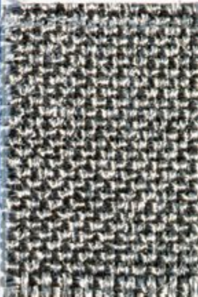
Lower part using expanding columns for fabric panels