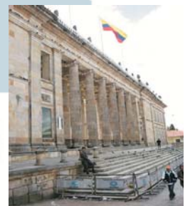
Edificio del Congreso de Colombia.

De esta manera, los diputados también se verían obligados a esforzarse más por constituir bancadas en vez de fundar nuevos partidos pequeños o cambiar de partido. Esta opinión también fue compartida por otros expertos. En cambio, se debería renunciar a un umbral en la fundación y la inscripción jurídica de partidos - que en la actualidad es del 2% - respetando el espíritu participativo de la Constitución de 1991.