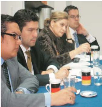
Los nuevos KAS-Papers pretenden consolidarse como grupos de especialistas de influencia, en temas actuales de la realidad colombiana.