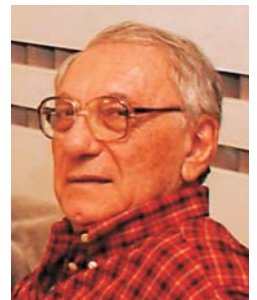
Prof. Dr. Sadik Al-Azm

A pesar del conflicto colombiano, que frecuentemente acapara toda la atención, es importante conocer conflictos internacionales. El abuso de la religión con fines terroristas es un tema complicado, el cual será tratado por el renombrado experto.