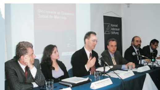
Panel invitado por la KAS para el lanzamiento del léxico en Economía Social de Mercado, en marzo de 2007.