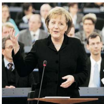
La Dra. Angela Merkel, Canciller de Alemania, es considerada una de las mujeres más poderosas del mundo.

Las últimas grandes giras latinoamericanas de cancilleres alemanes se remontan años atrás. Gerhard Schröder y Helmut Kohl visitaron respectivamente en los años 2002 y 1996 los tres países más grandes de la región: Brasil, Argentina y México.