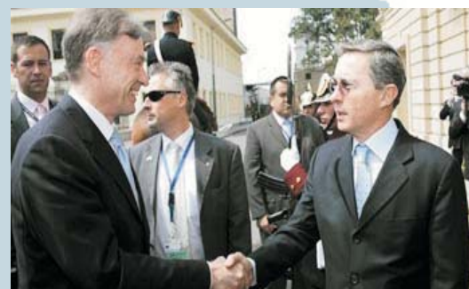
Encuentro entre los presidentes Köhler y Uribe, durante la visita del mandatario alemán a Colombia en marzo de 2007.