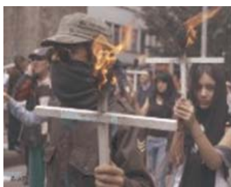
Marcha en contra la violencia en Bogotá.

Claro que también la Unión Europea ha incluido a las FARC en su lista de organizaciones terroristas. Tal hecho, sin embargo, no sería un obstáculo en opinión de Wieland. A su juicio, "en el momento en que las FARC entren en negociaciones políticas se las podría borrar de la lista".