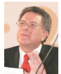
El Comisionado de paz representó al gobierno.

Los panelistas colombianos consideraron imperativa la búsqueda de una salida política y negociada al conflicto en nuestro país. Pese a los avances en materia de seguridad del gobierno del presidente Álvaro Uribe , se evidencian tales niveles de degradación y embotellamiento, que la misma salida militar del gobierno está perdiendo fuerza. Otra desventaja para el proceso de negociación y búsqueda de la paz consiste en que la política colombiana en este sentido es muy cambiante, en comparación a las estructuras hasta hora casi inamovibles de la guerrilla.