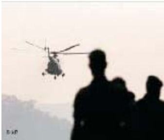
Un helicóptero de la Cruz Roja Internacional recogió a cuatro ex congresistas secuestrados por las FARC.

Francia ha querido, sin éxito, hacer “rehabilitar” a Chávez. ¿Cómo ve Ud. la actitud de Sarkozy ante el problema?