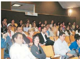
Fiscales de Antioquia y estudiantes participaron del foro.

La gran conclusión resultante de este ejercicio evidencia, de un lado, la necesidad de seguir trabajando en el tema, de allí la gran expectativa por dar inicio al diplomado en mediación penal y justicia restaurativa en los próximos meses; y de otro, la urgencia de dar un efectivo desarrollo y aplicación a estas figuras consagradas formalmente en nuestro Código de Procedimiento Penal.