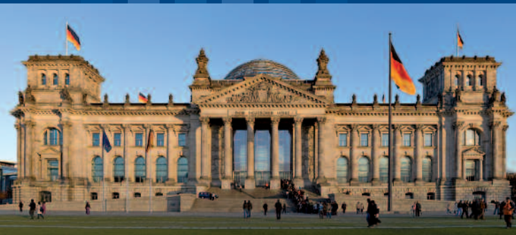
Das Reichstagsgebäude in Berlin