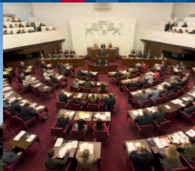
Plenarsitzung der Bremischen Bürgerschaft