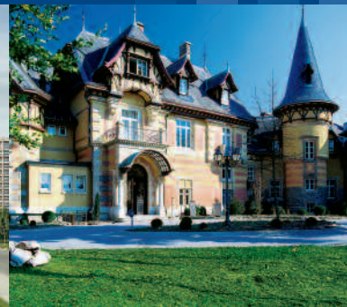
Villa Rothschild in Königstein