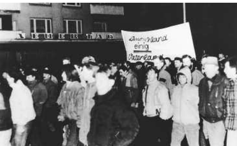
Montagsdemonstration im November 1989, vorbei an der Kreisredaktion des SED-Blattes „Neuer Tag“ in der damaligen Leninallee (heute Lindenallee)

mittel und Bahntarife zurückgenommen worden und wurden Maßnahmen zur Verschärfung des Klassenkampfes gegen „Besitzbürger“, Großbauern und Kirchen abgemildert, aber der Beschluss über die Erhöhung der Arbeitsnormen um mindestens zehn Prozent bis 1. Juli blieb in Kraft. Dieser betraf besonders die Arbeiterschaft und führte angesichts der unzureichenden Rohstoff- und Materialbereitstellung zu weiteren Lohneinbußen. In dieser Situation kam es am 16. Juni 1953 zur Demonstration der Bauarbeiter der Berliner Stalinallee. Die Nachricht von diesem Arbeiterprotest verbreitete sich – von „Westsendern“ verstärkt – wie ein Lauffeuer in der DDR. Bereits einige Stunden später meldeten die Verantwortlichen, dass die Hafendarbeiter des Neuen Hafens, wo Güter des EKS sowie des Hüttenzementwerkes Ost (HZO) umgeschlagen