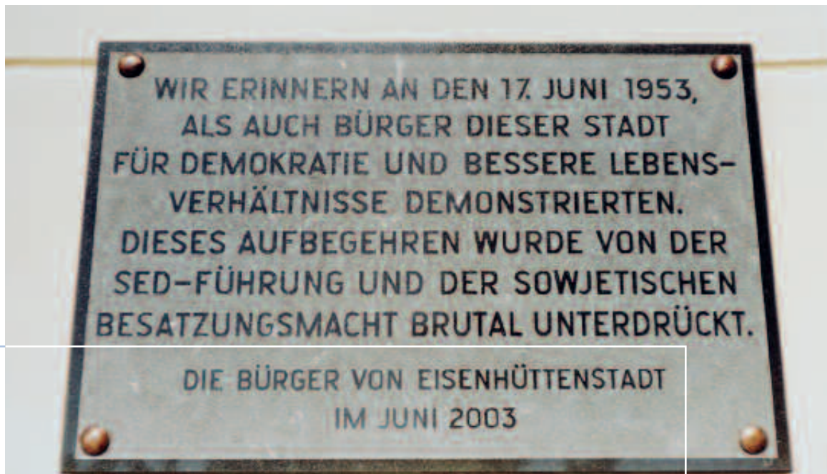
Erinnerungstafel am Rathaus Fürstenberg/Oder