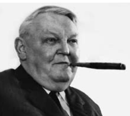
Der Erfolg der neuen Deutschen Mark im Verbund mit dem Konzept einer möglichst staatsfreien „Sozialen Marktwirtschaft“, so wie sie Ludwig Erhard proklamierte, entschied in der bundesdeutschen Öffentlichkeit die Auseinandersetzung zwischen sozialistischen und wirtschaftsliberalen Politikansätzen klar zugunsten Letzterer.

Das Archiv für Christlich-Demokratische Politik der Konrad-Adenauer-Stiftung wird an diese entscheidende Phase der deutschen Nachkriegsgeschichte erinnern. Dabei werden der Parlamentarische Rat und die Schritte auf dem Weg zur Sozialen Marktwirtschaft im Vordergrund stehen, aber auch die mutige Opposition der ostdeutschen Union gegen die Spaltung Deutschlands wird beleuchtet werden. Als Serviceleistung für die historische Forschung werden relevante Quellenübersichten online bereitgestellt und die wissenschaftlichen Ergebnisse in einem Internetportal einer breiten Öffentlichkeit zugänglich gemacht.