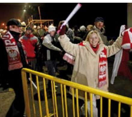
Am 20. Dezember 2007 feierten die Polen den Wegfall der Grenzkontrollen im Rahmen des Schengen-Abkommens, das freie Fahrt für Millionen Europäer bedeutet.

Wie in kaum einem anderen Land in Europa spielt in Polen die Kenntnis der eigenen Vergangenheit eine große Rolle. Die Geschichte war neben Sprache, Konfession und Kultur das wichtigste identitätsstiftende Element. Polen formierte sich im 19. Jahrhundert als moderne Nation. Ähnlich wie die zeitgleich verlaufene Verfassungsbewegung Belgiens bildete auch in Polen der Konstitutionalismus ein wichtiges Element des nationalen Selbstbewusstseins und Freiheitsbestrebens (Krzysztof Ruchniewicz, Breslau). Obwohl die moderne Nationalgeschichte Polens und der Freiheitskampf gegen die Vorherrschaft der Sowjetunion in den 1980er Jahren in einem anderen Kontext standen, so wird man doch gewisse Kontinuitäten im Selbstbild der Polen und ihres nationalen Selbstbehauptungswillens ausmachen können. Als verständlich mag daher erscheinen, dass nach der langen Unterdrückung der eigenen Kultur und der nationalen Autonomie – zunächst durch den NS-Staat, dann durch die Sowjetunion – in den letzten beiden Jahrzehnten eine starke Rückbesinnung auf nationale Werte und regionale Eigenarten zu beobachten ist – eine ähnliche Entwicklung wie in den anderen mittelosteuropäischen EU-Ländern.