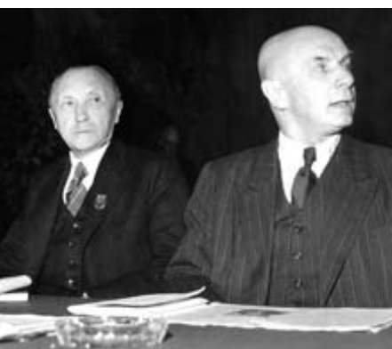
Im Oktober 1950 wurde auf dem Gründungsparteitag der CDU in Goslar Konrad Adenauer (l.) mit großer Mehrheit zum Parteivorsitzenden gewählt. Jakob Kaiser, der zuvor als Vorsitzender der CDU in der Sowjetischen Besatzungszone von den Sowjets abgesetzt worden war, wurde einer seiner Stellvertreter.

Parallel zur Stalinisierung der SBZ verschlechterten sich die Beziehungen zwischen den westlichen Alliierten und der Sowjetunion im Frühjahr 1948 rapide. Der Verfall der Reichsmark infolge eines von Hitler durch Kredite finanzierten Krieges, aber auch der ungehemmten Geldschöpfung der Siegermächte zur Begleichung der Besatzungskosten machte einen Währungsschnitt zur Gesundung der Wirtschaft notwendig. Da