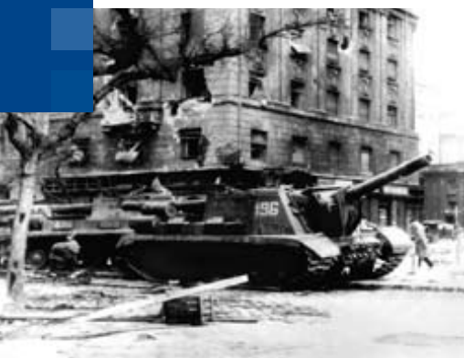
Der Volksaufstand in Ungarn 1956, mit dem sich die Ungarn von der sowjetischen Unterdrückung befreien wollten, wurde niedergeschlagen. Seine Bedeutung für die friedliche Revolution 1989 in Ungarn ist unbestreitbar.

Obwohl heute generell festzustellen ist, dass ehemals festgefügte nationale Geschichtsbilder verblassen, gibt es dennoch eine Vielzahl von Prägungen, deren sich die Europäer erinnern müssen, wenn sie unter „Vertiefung“ der EU nicht nur ökonomische und bürokratische Reformen verstehen. Diese Prägungen betreffen die von Europa ausgehenden Freiheits- und Modernisierungsbewegungen, zum Beispiel die Trennung von Religion und Politik, die Emanzipationsprozesse von Humanismus und Renaissance, von Reformation, Aufklärung, und die aus ihnen hervorgegangenen Demokratie- und Rechtsstaatsideen. Sie sind auch für EU-Gesellschaften normierend.