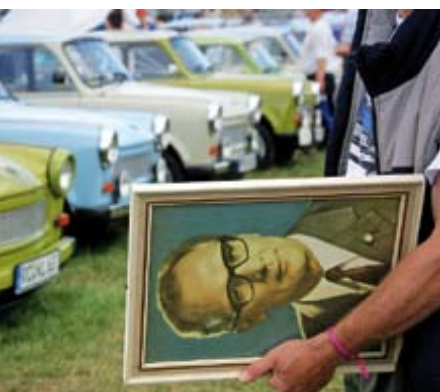
Ostalgie auf dem 14. Internationalen Trabant-Fahrer-Treffen im Juni 2007 in Zwickau.

Außerdem wird 2008 ein elektronisches Portal unter dem Arbeitstitel „Das war die DDR“ als überjähriges Projekt aufgebaut. Die Federführung übernimmt die Hauptabteilung Politische Bildung und hier insbesondere das Bildungszentrum Schloss Wendgräben im Benehmen mit dem Archiv für Christlich-Demokratische Politik/Wissenschaftliche Dienste (ACDP/WD). Ziel des Portals ist es, den Nutzern Informationen über Alltag, Medien, Kultur, Kirche, Wissenschaft, Schule, Ideologie etc. in der DDR zu geben. Darin eingeschlossen sind auch didaktisch-methodische Hinweise zur Vermittlung der Thematik für Multiplikatoren sowie Lehrerinnen und Lehrer.