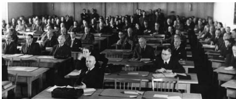
Konstituierende Sitzung des Parlamentarischen Rates am 1. September 1948.