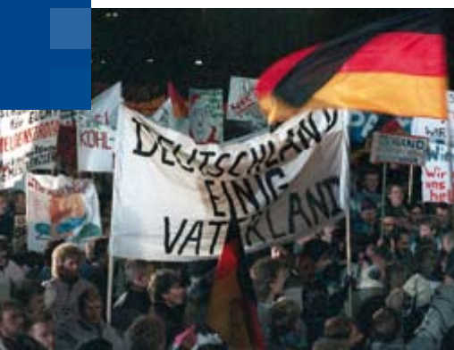
Montagsdemonstration in Leipzig am 11. Dezember 1989

So scheint sich das Phänomen „DDR“ einer objektiven Wahrnehmung zunehmend zu entziehen. Ein großer Teil der ehemaligen DDR-Bürger verklärt die Vergangenheit. Der Alltag in der Diktatur wird sehr oft als angenehm, geschützt, wohlgeordnet und sozial sicher bewertet. Negative Aspekte werden vollkommen ausgeblendet. Teilweise scheint