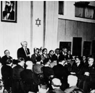
Durch die Proklamation der Unabhängigkeit des Staates Israel durch Ministerpräsident David Ben Gurion im Stadtmuseum von Tel Aviv wird am 14. Mai 1948 der Staat Israel gegründet.

Mit Deutschland und den Deutschen wollten die meisten in Israel – verständlicherweise – niemals wieder etwas zu tun haben. „In unserem jungen Staat“, schrieb Shimon Peres rückblickend, „überwog die Auffassung, dass der Bruch mit Deutschland endgültig und für ewig sein müsse.“ Es ist das persönliche Verdienst von David Ben Gurion und Konrad Adenauer, den Gründervätern und ersten Regierungschefs beider Länder, dass trotz der Schlucht der Vergangenheit zwischen beiden Völkern Vertrauen wieder Fuß fassen und die Grundlagen einer tragfähigen Freundschaft gelegt werden konnten. Als sie sich am 14. März 1960 im New Yorker Waldorf Astoria Hotel das erste Mal trafen, taten sie das in dem Bewusstsein, an einem Neuanfang mitzuwirken. Beide geschichtsbewusst, unbirrbar grundsatztreu, mit dem Mut, gegen den Strom zu schwimmen, darauf