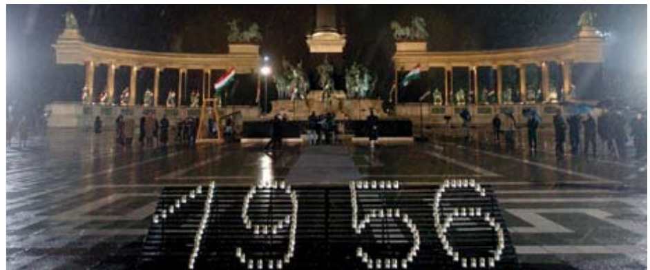
Fünfzig Jahre später begehen die Menschen in Budapest den Jahrestag des Volksaufstands von 1956.