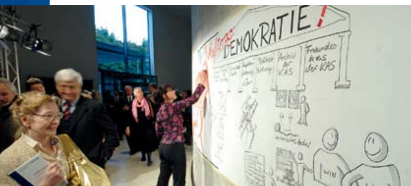
Im Foyer der Akademie entstand ein „demokratisches“ Kunstwerk.

Hier setze die Rolle der politischen Stiftungen an. Sie seien gefordert, den Bürgerinnen und Bürgern Orientierung zu geben, gerade wenn es um die Auseinandersetzung mit kontroversen Fragen gehe. Daher müsse es ein Ziel sein, neben den engagierten Akteuren in der Gesellschaft auch diejenigen anzusprechen, die noch nicht genug über die Möglichkeiten der Demokratie wissen. Ebenfalls wichtig sei die bessere Vermittlung von ethischen, historischen und kulturellen Fundamenten unserer europäischen Gesellschaftsordnung. Für Schäuble spielt hier das Internet eine wesentliche Rolle. Es sei für die politischen Stiftungen wichtig, den virtuellen politischen Raum mitzugestalten.