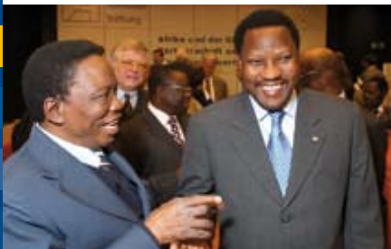
Yawovi Agboyibo, Premierminister von Togo (l), und Hama Amadou, damaliger Premierminister von Niger (r), in der Akademie der KAS in Berlin.