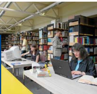
Der Leseraum der Bibliothek.