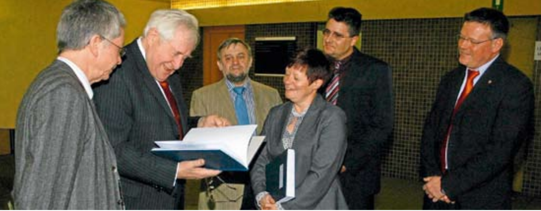
Mitarbeiter der Stiftung überreichen Professor Bernhard Vogel aus Anlass seines 75. Geburtstags einen Band, der die „archivalischen Spuren“ seines politischen Lebens dokumentiert.