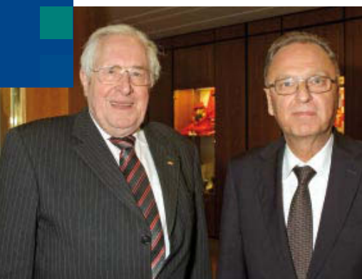
Der Vorsitzende der Konrad-Adenauer-Stiftung, Professor Bernhard Vogel, und der Präsident des Bundesverfassungsgerichts, Professor Hans-Jürgen Papier.