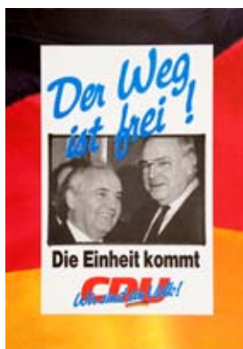
Plakat zur Volkskammerwahl, die am 18. März 1990 stattfand.

Hat die Bundesregierung die Länder bisher aus den Verhandlungen mit der DDR weitgehend heraushalten können, so gelingt das bei den Verhandlungen über den Einigungsvertrag nicht mehr. Mit dem Sieg Gerhard Schröders bei der Landtagswahl in Niedersachsen im Mai 1990 verlieren die CDU/CSU-regierten Länder im Bundesrat die Stimmenmehrheit. Außerdem benötigt die Bundesregierung für den zweiten Staatsvertrag, der die Einigung besiegeln soll und ohne Änderungen des Grundgesetzes nicht zu bewerkstelligen ist, die Stimmen der SPD für eine Zweidrittelmehrheit. Somit ist die Regierung Kohl gezwungen, sich mit den Sozialdemokraten zu arrangieren. Der Schachzug des Bundesinnenministers Wolfgang Schäuble, die Verhandlungen über den Einigungsvertrag so weit vorzubereiten, dass alle notwendigen Prüfungen für einen Beitritt erfolgt sind, bevor die eigentlichen Verhandlungen beginnen, führt zum Erfolg. Es soll nur noch darüber gesprochen werden, was die beitriftswillige DDR-Regierung als verhandlungsnotwendig erachtet. Weitreichende Veränderungen an dem politischen und gesellschaftlichen System der Bundesrepublik sind nicht erforderlich. Mit dem Beitritt der DDR nach Artikel 23 des Grundgesetzes bestätigt die Bundesregierung ihre seit vierzig Jahren vertretene Kernstaatstheorie.