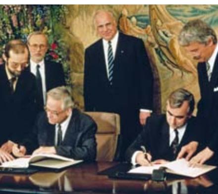
Die Unterzeichnung des Staatsvertrags zwischen der Bundesrepublik und der DDR über die Wirtschafts-, Währungs- und Sozialunion am 18. Mai 1990 war ein wichtiger Schritt auf dem Weg zur deutschen Wiedervereinigung.

Bundeskanzler Kohl entschließt sich zum Strategiewechsel, indem er drei Grundsatzentscheidungen trifft. Er strebt die Wiedervereinigung in Form einer bundesstaatlichen Lösung so schnell wie möglich an. Zudem will er mit dem Vorschlag einer Wirtschafts-, Währungs- und Sozialunion mit der DDR die innerstaatliche Wiedervereinigung vorantreiben. Darüber hinaus gelingt es dem Kanzler, mit der Wahl der parteipolitischen Bündnispartner in der DDR und der Zusammenführung der Allianz für Deutschland eine Wahlkampfplattform für die Volkskammerwahlen zu schaffen und über die Parteigremien Einfluss auf die innenpolitische Entwicklung in der DDR zu erlangen. Gleichzeitig lehnt die Bundesregierung umfangreiche Wirtschafts- und Finanzhilfen für die Regierung Modrow ab, bis am 18. März 1990 in freien Wahlen die Volkskammer