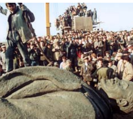
Eine Menschenmenge umringt im März 1990 in Bukarest eine umgestürzte Lenin-Statue – Symbol für das Ende des Kommunismus. Seit dem Sturz des Diktators Nicolae Ceaușescu herrschten in Rumänien bürgerkriegsähnliche Zustände.

Er klopfte immer wieder an das Mikrofon und stotterte: „Hallo, hallo, hallo! Genossen! Verhalten Sie sich ruhig!“ Im Hintergrund rief seine Frau: „Ruhe! Ruhe! Ruhe!“. Einstudierte Sprechchöre „Ceaușescu-Romania!“ verschafften ihm nach einigen Minuten noch einmal die Chance zu sprechen. Die Kameraobjektive richteten sich wieder auf ihn. Ad hoc versprach er eine Erhöhung der Mindestlöhne, des Kindergeldes und der Renten. Doch die Unruhe der Massen nahm zu. Die Fernsehübertragung wurde abgebrochen. Die Fernsehzuschauer sahen als letztes Bild das von ungläubiger Verblüffung verzerrte Gesicht ihres Präsidenten. Drei Tage später wurde er gemeinsam mit seiner Frau Elena hingerichtet. Europa war vom Kommunismus befreit.