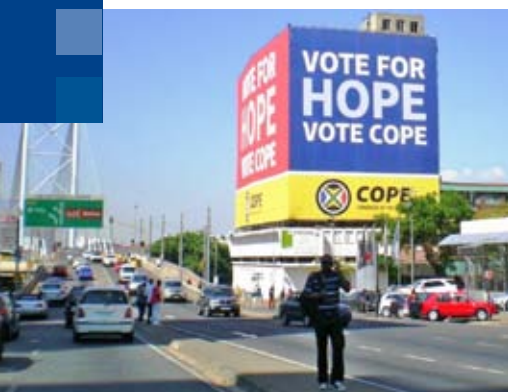
Der Congress of the People (COPE) etablierte sich bei den Wahlen 2009 auf Anhieb als drittstärkste Kraft. Lange Schlangen bildeten sich vor den Wahllokalen.

Anklagen wegen Korruption, Geldwäsche, Bestechung und Betrug gegen Jacob Zuma selbst wurden auf wundersame Art kurz vor der Wahl fallen gelassen. Das Verfahren gegen Zuma hatte sich über sieben Jahre hingezogen – und eine Wiederaufnahme scheint in immer weitere Ferne zu rücken, je mehr strategische Positionen in Staat und Regierung der neue Staatspräsident mit persönlichen Freunden und langjährigen Unterstützern besetzt. Die Ernennung von genehmen Richtern und die offenen verbalen Angriffe auf die Justiz lassen die Befürchtungen um die Zukunft der eigentlich so starken