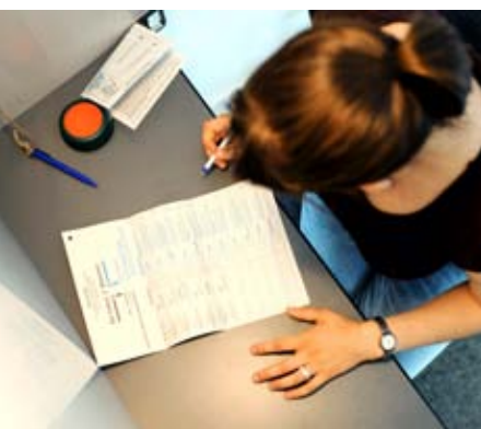
Bei der Bundestagswahl vom September 2009 errang die Union ein Ergebnis nahe an der magischen Vierzig-Prozent-Marke. Entscheidend dafür war ihre Wirtschaftskompetenz, wie eine Umfrage der KAS ergab.

Für die Union ist diese Tatsache und die schwierige Entwicklung bei der SPD freilich weder Grund zur Häme noch zur Selbstzufriedenheit. Vielmehr drängen sich auch für sie Lehren aus diesem Exempel auf. Eine Erneuerung der alten Kraft der Volksparteien