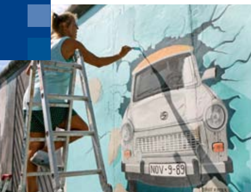
Die Berliner Mauer – heute ein großes, buntes Denkmal wie hier an der East Side Gallery. In den Köpfen der Menschen ist sie mittlerweile klein, wie eine Umfrage der KAS ergab.

Von den jüngeren Befragten wird der Verlauf der Wiedervereinigung seit dem Fall der Mauer positiv bewertet. Dies gilt bei der Frage nach der Erfüllung von Freiheit und Demokratie, aber auch hinsichtlich der materiellen Verbesserung der Situation in den neuen Ländern. Die jüngeren Befragten bewerten die Angleichung der Lebensverhältnisse deutlich positiver als die älteren Jahrgänge. Somit ist in dieser Altersgruppe zwar eine gewisse Unkenntnis über die Ursachen des Mauerfalls vorhanden, was eine geringere emotionale Verankerung der Ereignisse zur Folge hat, doch schätzt sie die