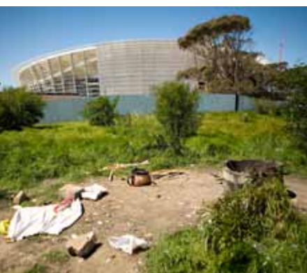
Die Unterschiede zwischen Arm und Reich in der „Regenbogennation“ sind nach wie vor sehr groß. Das Bild zeigt ein verlassenes Obdachlosencamp im Schatten des Green Point Stadium in Kapstadt (Oktober 2009).

Dabei sah vor rund fünfzehn Jahren alles so vielversprechend aus: Nelson Mandela ging aus den ersten demokratischen Wahlen von 1994 als klarer Sieger hervor, und das Land sah sich im Aufbruch. Mit der erfolgreichen Transformation und dem Ende der politischen und wirtschaftlichen Isolation stiegen auch die Erwartungen an das „Regenbogenland“. Doch sowohl innen- als auch außenpolitisch sieht es anderthalb Jahrzehnte nach dem Ende der Apartheid alles andere als rosig aus.