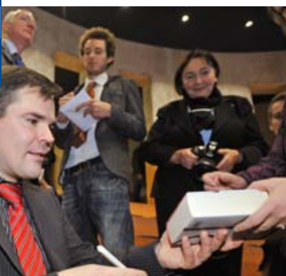
KAS-Literaturpreisträger bei der Arbeit: Herta Müller (2004) und Uwe Tellkamp (2009) signieren ihre Werke. Die Aufnahmen entstanden jeweils nach der Preisverleihung in Weimar.