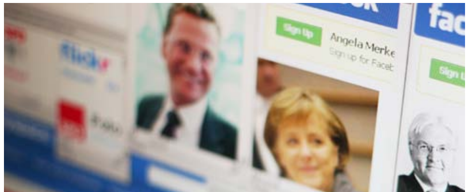
Im Bundestagswahlkampf 2009 nutzten die deutschen Parteien verstärkt das Internet: Vor allem die Portale Twitter, YouTube und Facebook waren sehr beliebt.

Es ist heute unbestritten: Das Internet gehört zum Standardinstrument der politischen Kommunikation. Es trägt maßgeblich zum Erfolg oder Misserfolg einer Kampagne bei und kann ein entscheidender Pfeiler für die Organisation von Politik und Partei sein. Es gibt vielen Engagierten und Interessierten neue Möglichkeiten, sich in den politischen Prozess einzubringen. Die deutschen (Volks-)Parteien müssen Antworten auf die gesellschaftlichen, aber auch technologischen Herausforderungen finden, wollen sie nicht zwischen aktiven Netzwerken zerrieben werden. Dies wird nur gelingen, wenn man sich auf das Medium einlässt und seine Nutzer ernst nimmt.