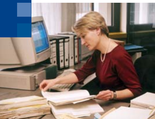
Die Spreu vom Weizen trennen: Nach sorgfältiger Sichtung wird das Bewahrenswerte archiviert.

Das gleiche Problem stellt sich in verschärfter Form auch bei der Sicherung elektronischer Dokumente wie E-Mails oder Textdateien. Zwar kann das ACDP bei der Akquisition der Akten, die etwa in einer Kreisgeschäftsstelle in den 1990er Jahren entstanden sind, auch deren Disketten, Festplatten etc. mit übernehmen. Bei der Sicherung kommt aber zum beschriebenen Problem der Speicherung noch hinzu, dass häufig damals verwendete Dateiformate mit heutiger Software kaum mehr lesbar sind: Word-Perfect oder Word für Dos 1.0 sind nicht mehr gängig. Hier kann man deshalb nur mit Zwischenlösungen arbeiten. Um den zukünftigen Anforderungen der digitalen Überlieferung gerecht zu werden, hat sich das ACDP entschlossen, ein digitales Archiv aufzubauen. Das Offline Web Archiv wird so weiterentwickelt, dass es dem derzeit fortschrittlichsten Standard der elektronischen Archivierung, dem ursprünglich für Daten der NASA entwickelten OAIS-Standard, entspricht. So wird es demnächst möglich