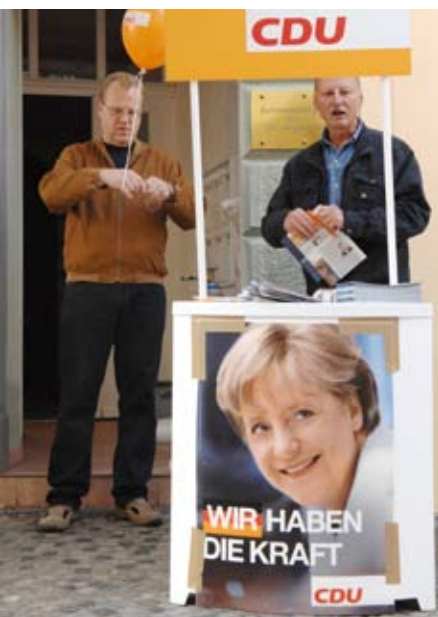
Gehören Infostände der Parteien bald der Vergangenheit an?

Es ist nicht nur die Politik, die lernen muss, mit den neuen Instrumenten des Web 2.0 umzugehen. Auch die Nutzer – Bürger und Wähler – werden sich erst langsam der (politischen) Informations- und Einflussmöglichkeiten bewusst. Aber auch hier hat Obama einen entscheidenden Beitrag geleistet. Nicht nur beim Spenden wurden Bür-