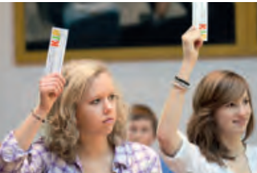
Einübung in Demokratie. Democracy, hands-on.

75 Prozent konzedieren sogar, dass persönliche Interessen zurückgestellt werden sollten, wenn das Großprojekt dem Wohle der Allgemeinheit dient. Aber wie die Realität zeigt, siegt die staatsbürgerliche Vernunft nicht immer über Sankt Florian. Immerhin lässt die letzte Zahl darauf hoffen, dass das Ego-Prinzip in der Gesellschaft noch nicht die Alleinherrschaft angetreten hat.