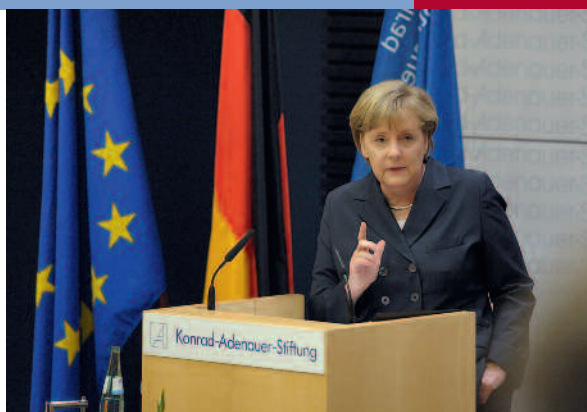
Bundeskanzlerin Dr. Angela Merkel auf dem Tag der KAS.

Die Rede der Bundeskanzlerin, Dr. Angela Merkel, war der Höhepunkt dieser Veranstaltung, die in 2011 ganz im Zeichen des Arbeitsschwerpunkts Integration stand. Persönliches Engagement für eine integrative und funktionierende Gesellschaft, das war die Kernbotschaft der Kanzlerin. Sie machte deutlich, dass in der Integrationsdiskussion kein Platz für Pauschalisierung oder Übertreibung ist: „Wir brauchen eine Debatte mit Maß und Mitte.“ Dazu gehören aus Merckels Sicht vor allem zwei Grundsätze: „Erstens: Wir reden nicht über, sondern mit Migranten. Und Zweitens: Wir fördern und wir fordern.“ In Lesungen, Präsentationen und Filmvorführungen wurde die nationale und inter-