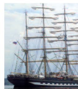
Russisches Segelschulschiff Kruzenshtern

Der letzte Tag begann mit einem Tagestörn auf dem holländischen 2-Mast-Schoner „Oban“. Es war ein Ausflug auf der Kieler Förde mit Shantymusik, Tanz und Seemannsliedern. Dieser herrliche Tag endete mit einem großartigen Feuerwerk. Auch 2009 bieten wir dieses Seminar wieder an (s. Veranstaltungshinweise S. 7).