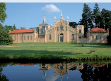
Gotisches Haus im Dessau-Wörlitzer-Gartenreich

„Amerika hat keinen besseren Partner als Europa“, mit diesen Worten hat Barack Obama bei seiner Kundgebung an der Siegestsäule in Berlin für ein neues Verhältnis zwischen Europa und den USA geworben. Nach dem Präsidentenwechsel im Januar 2009 soll dieses Seminar das Verständnis für die USA verbessern und den Wandel in den transatlantischen Beziehungen sowie das Verhältnis USA/Europa darstellen. Diese Thematik wird mit Amerika-Kennern, Soziologen und Politikern besprochen. Angefragt für das Thema „Perspektiven der amerikanischen Außen- und Sicherheitspolitik“ ist Volker Rühle, ehemaliger Bundesminister der Verteidigung. Ausflüge zur amerikanischen und zur russischen Botschaft nach Berlin und nach Wittenberg mit einer Schlossführung und einer Gondelfahrt durch das Dessau-Wörlitzer-Gartenreich (Welterbe der UNESCO) runden das Programm ab.