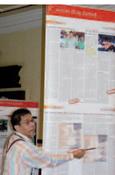
Stärkung der „vierten Gewalt“. Ausbildung von Journalisten – Politische Bildung in Indonesien