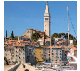
Bild oben: Reisegruppe auf dem Schlossberg in Graz Bild links: Belvedere in Wien Bild rechts: Die Altstadt von Rovinj

slawischen und deutschen Kulturkreis beeinflusste Halbinsel Istrien war ein weiterer Höhepunkt der Reise. Den Teilnehmern wurden auch die unterschiedlichen Interessen und Konflikte in dieser Region während der ersten Hälfte des 20. Jahrhunderts nähergebracht.