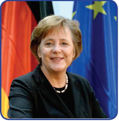
მარკაროს თაქით, გერმანიის მარ- შვიკაროვარა საზოგადოებას კა- ხი განიხილა.

იმიგრაციის საკითხი და მისი გადაჭ- რის მეთოდების ძიება, დღეისათვის ძა- ლზე მწვავედ დგას გერმანიის ხელისუ- ფალთა წინაშე. ქრისტიან-დემოკრატი- ული პარტიის ახალგაზრდული ფრთის შეკრებაზე სიტყვით გამოსულმა გერ- მანიის კანცლერმა, ანგელა მერკელმა აღიარა, რომ ქვეყანაში მულტიკულ- ტურული საზოგადოების მშენებლობა წარუმატებელი გამოდგა