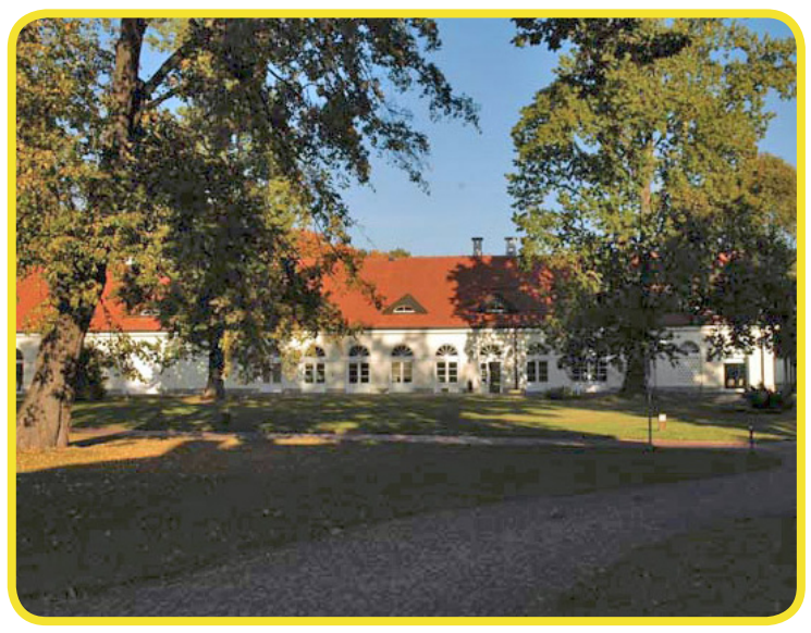
ბრიუკეს ევროპული კოლეჯი

ავსტრიის კორპუსის სტიპენდიები 'ავსტრიის საზღვარეულო უნივერსიტეტში' (ENP) განათლებადი კვალიფიკაციის უმაღლესი სასწავლო კურსებისთვის კარგადმზადებული სტუდენტებისთვის