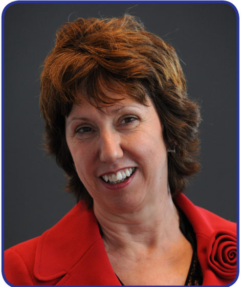
ავსტრიის ვაჭარული პოლიტიკის უმაღლესი წარმომადგენელი — კეტრინ ეშტონმა სპეციალური განცხადება გააკეთა და უკრაინას თავისუფალი და სამართლიანი არჩევნების ჩატარება მიულოცა.

ევროკომისიის შემოთავაზებას ასევე იწვევს ევროპის მართლმსაჯულების სასამართლოში შეტანილი სარჩელების რაოდენობა, რომლებიც უკანონო ნაგავსაყრელებსა და ამ საკითხზე ქვეყნების არაადეკვატურ რეაქციას ეხება.