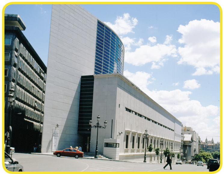
ესპანეთის პარლამენტის შენობა

1975 წელს ესპანეთში კონსტიტუციური მონარქია აღსდგა და შემოღებულ იქნა საპარლამენტო სისტემა — გენერალური კორტეხები, რომელიც შედგება ზედა პალატის — სენატისა და ქვედა პალატის — დეპუტატთა კონგრესისგან.