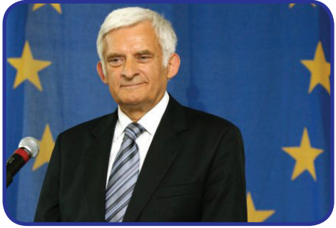
ბუზუკი სოციალურ ქსელს ახსენებს

ევროპის პარლამენტის პოლონელმა თავმჯდომარემ - იერჟი ბუზუკმა ევროპის მოქალაქეებთან კომუნიკაციის გასაადვილებლად სოციალურ ქსელ "Twitter"-ზე საკუთარი გვერდი შექმნა. ბუზუკი ევროპარლამენტის პირველი თავმჯდომარეა, რომელიც პროფესიულ საქმიანობაში მიკრო-ბლოგის მომსახურებას იყენებს.