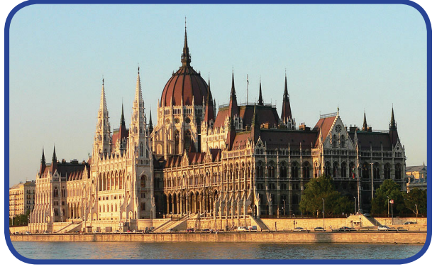
ორგანო – ავსტრიის რაიხსტაგი და უნგრეთის სეიმი.