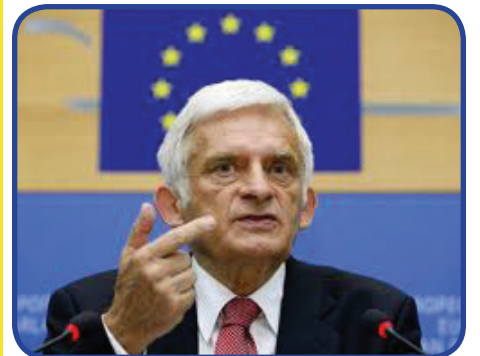
გამოყენებული წყაროები: www.euractiv.com ; www.euobserver.com ; www.europeanvoice.com

ლისაბონის ხელშეკრულება და ევროკავშირის ახალი გრძელვადიანი სტრატეგია „ევროპა 2020“ კავშირს მოქმედების მეტ საშუალებას აძლევს. ევროპარლამენტი განაგრძობს ბრძოლას იმისთვის, რომ მოიპოვოს დამატებითი რესურსები კავშირის მოთხოვნების დასაკმაყოფილებლად, აღნიშნა ბუბეკმა.