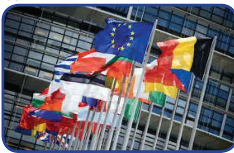
ბრიუსელი უფროსი ევროკავშირის ოფისიარული პიკაპი, შავიპიკოვან პანახაჯაბი

მალმსტრომი ასევე შეხვდა მოლოდინებს პარლამენტის თავმჯდომარეს. შეხვედრაზე განიხილეს ევროკავშირთან თანამშრომლობის საკითხები მოზილურობის, მიგრაციის და უსაფრთხოების კუთხით.