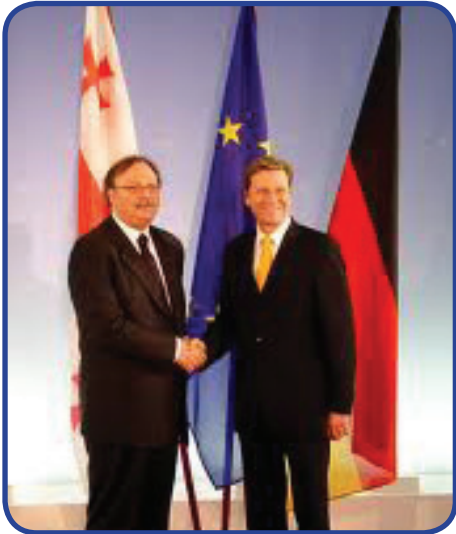
საქართველოს საგარეო საქმეთა მინისტრი გრიგოლ ვაშაძის ბრიუსელში ვიზიტისას შედგა ოფიციალური შეხვედრა ევროკომისართან გაფართოებისა და ევროპული სამეზობლო პოლიტიკის დარგში, შტეფან ფულესთან.

2011 წლის 1 თებერვალს საქართველოს საგარეო საქმეთა მინისტრის, გრიგოლ ვაშაძის ბრიუსელში ვიზიტისას შედგა ოფიციალური შეხვედრა ევროკომისართან გაფართოებისა და ევროპული სამეზობლო პოლიტიკის დარგში, შტეფან ფულესთან.