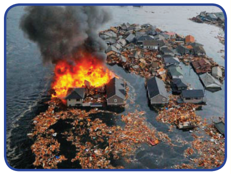
ევროპარლამენტი იპონურ საკვებზე რაფინირირი მარკეტების გამოკვლევას აპირებს