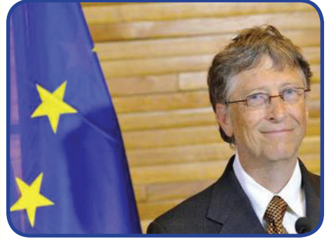
ბილ გეთისი: „ათასწლეულის განვითარების მიზნები (MDG), მათ შორის სიღარიბის დაძლევა, შესაძლებელი იქნება, თუ მდიდარი ქვეყნები შეასრულებენ თავიანთ დანაპირებს დახმარების შესახებ. მიუხედავად ამისა, კომპანია Microsoft-ის დამფუძნებლის და ფილანტროპ ბილ გეთისის თქმით, დასახული მიზნის მიღწევას ვადა, რომელიც 2015 წლისთვის იყო განსაზღვრული, კიდევ 6 წლით გადაინევის.“

კოზის აზრით, განხილულ უნდა იქნას შენგენის ზონის შიგნით სასაზღვრო კონტროლის დროებითი აღდგენის შესაძლებლობა, ვინაიდან საგარეო საზღვრების მართვა „განსაკუთრებული სირთულით“ ხასიათდება.