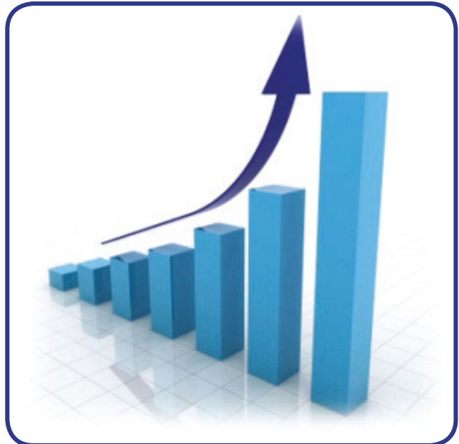
ანთხრობის სკოლის ფასები 2009 წ. ა. შ.

www.euractiv.com ; www.euobserver.com ; www.europeanvoice.com