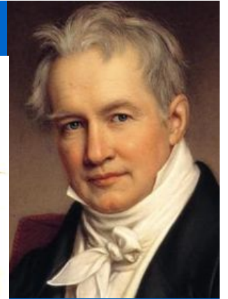
Alexander von Humboldt (14.09.1769 – 06.05.1859)