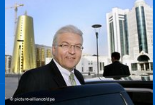
Bundesaußenminister Steinmeier zu Besuch in der kasachischen Hauptstadt Astana