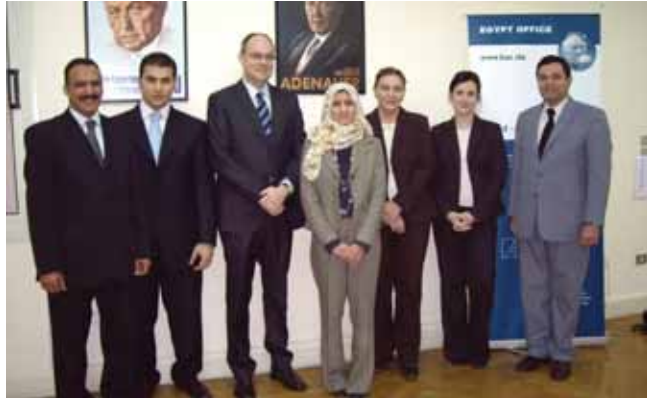
مجموعة العمل الجديدة بمؤسسة كونراد أديناور

سوف تستمر المؤسسة كذلك في ٢٠٠٨ في طرح أفكار وموضوعات جديدة وبناءة وسوف تواصل العمل علي دعم الديمقراطية وسيادة القانون من خلال تقديم دورات تدريبية للشباب والشابات الناشطين سياسياً والصحفيين والصحفيات، كما ستقوم المؤسسة بتنظيم مؤتمرات وورش عمل تهدف إلي الإعداد للانتخابات المحلية وسوف تتطرق أيضاً إلي موضوعات عدة مثل