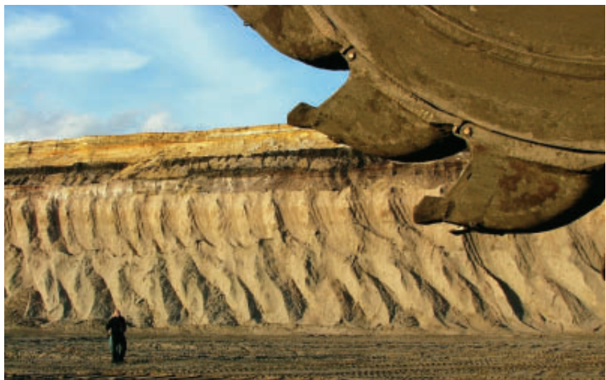
Saubere Kohlekraftwerke, die wenig bis kein CO 2 an die Umwelt abgeben, sind wegen der auch künftig in vielen Ländern zur Verstromung eingesetzten Kohle extrem wichtig für den globalen Klimaschutz.

Damit sich diese beträchtlichen Investitionen in den Klimaschutz rentieren, muss aber ein verlässlicher Preis für CO 2 weltweit als Kostenfaktor in Rechnung gestellt werden. Der im Rahmen der EU praktizierte Handel mit Emissionsrechten ist ein erster Schritt in diese Richtung. Wichtig und unverzichtbar ist jedoch, dass sich auch die größten Emittenten einer solchen Regelung nicht verschließen und weitere große Verbrauchssektoren, wie z. B. Auto-, Schiffs- und Luftverkehr sowie die Privathaushalte, künftig einbezogen werden. Politik und Energiewirtschaft setzen große Hoffnungen auf einen Erfolg der weltweiten Forschungs- und Entwicklungsbemühungen. Als Prämie winken den Unternehmen, die hier investiert haben und diese neue Technologie zuerst patentieren und wirtschaftlich einsetzen, riesige Wachstums- und Exportmärkte. Damit würden die weltweiten Kohlevorräte als wertvolle fossile Brennstoffe künftig klimaverträglich eingesetzt werden können. Dies wäre ein doppelt positiver Beitrag zum Klimaschutz und zur Energiesicherheit.