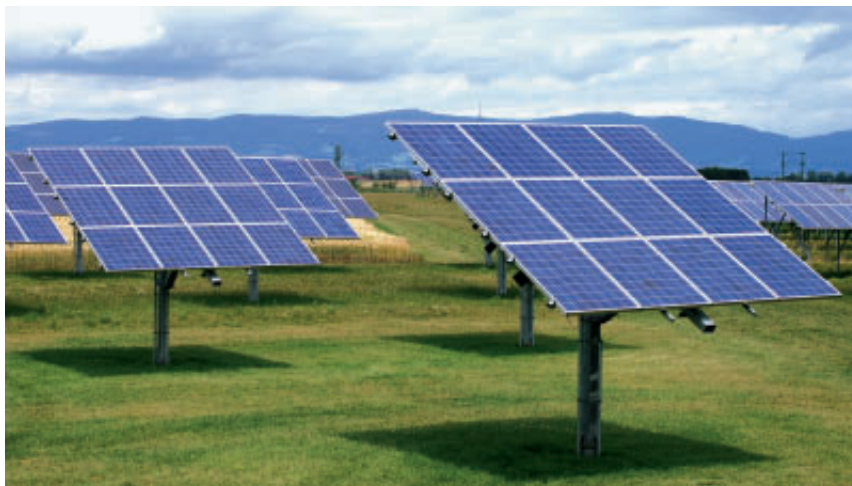
Der Einsatz und Ausbau von erneuerbaren Energien ist eine Schlüsselgröße für alle energie- und klimapolitischen Visionen.

Die Solarindustrie boomt in Deutschland, insbesondere im Photovoltaik-Bereich, nicht zuletzt wegen günstiger Einspeisetarife für Strom, trotz relativ geringer Sonnenscheindauer. Der Grundstoff Silizium ist schon knapp geworden und verteuert somit die Solar-Panels. Doch die Auftragsbücher der Branche sind gerade auch für den Export gut gefüllt. Etwas anders sieht es bei der solarthermischen Anwendung aus, obwohl auch hier deutsche Unternehmen marktführend sind. Der Bau von ersten Kraftwerken muss zwangsläufig in Südeuropa, wie z. B. in Spanien, erfolgen, wegen der günstigen Sonneneinstrahlung und höheren Effizienz. Es gibt weiter reichende Pläne, diese neue Technologie auch im Sonnengürtel der Sahara in Nordafrika zum Einsatz zu bringen. Solarthermische Kraftwerke könnten Strom für den Bedarf vor Ort und auch für den Export nach Westeuropa produzieren, aber auch Prozesswärme. Diese könnte in Meeresnähe zur Entsalzung