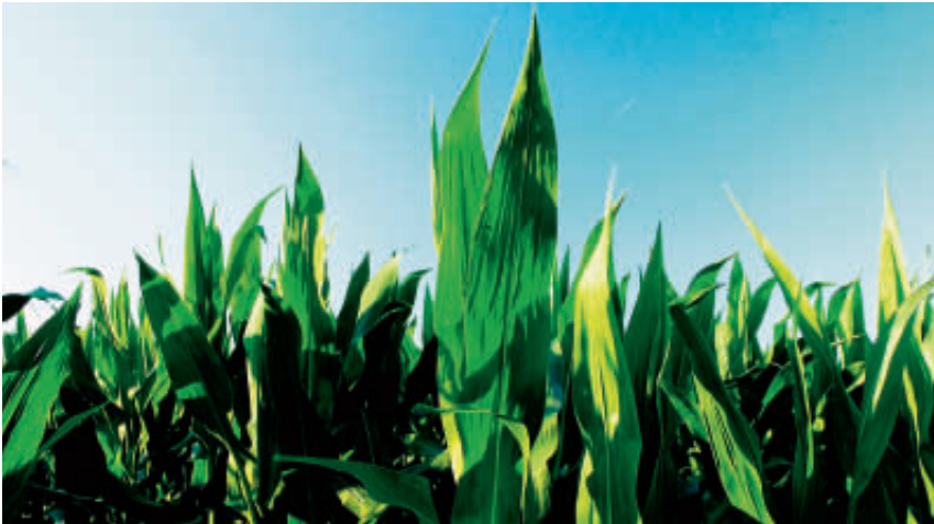
Nachwachsende Rohstoffe – die sogenannte Biomasse – haben einen zentralen Stellenwert erhalten.