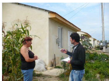
Ein Workshopteilnehmer beim Interview in einem Flüchtlingsdorf bei Gori

Watergate, Flick-Affäre, Elf-Aquitaine... All diese Skandale, wären ohne umfassende und gründliche journalistische Recherchen nicht aufgedeckt worden. Investigativer Journalismus versteht sich als ein Kontrollorgan der Demokratie. Journalisten, die investigativ arbeiten wollen, müssen hohen professionellen Standards genügen.