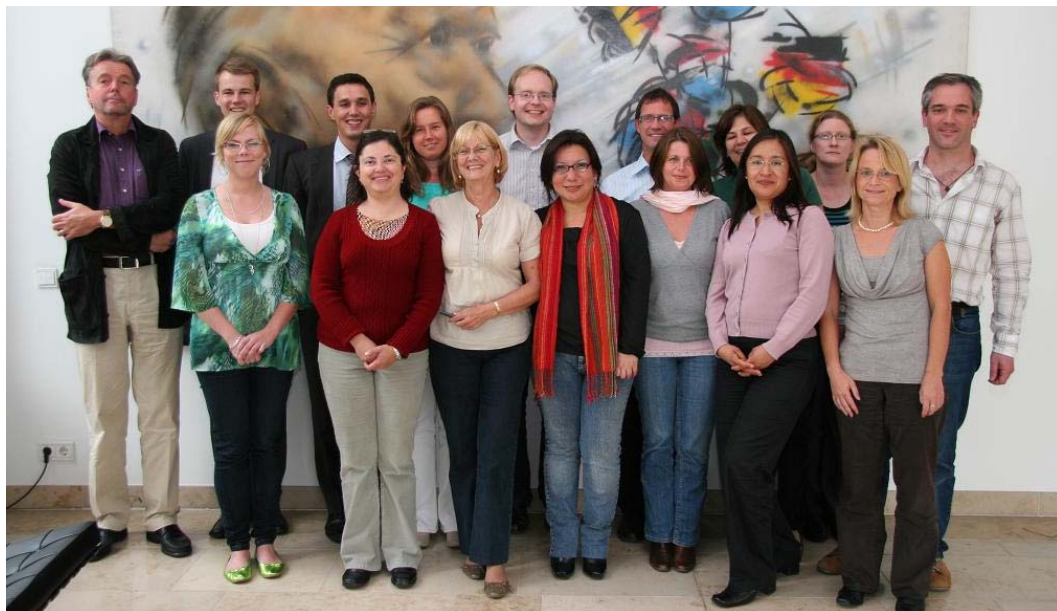
Teilnehmer und Trainer der PASTIS-Multiplikatorenschulung für die PASTIS-Einführung in Lateinamerika

PASTIS erfordert umfangreiche Schulungen, die sich für die Kolleginnen und Kollegen im Ausland auf mehrere Lernphasen verteilen: Nach einer fünftägigen Präsenzveranstaltung, auf der die wesentlichen Funktionen von PASTIS vermittelt werden, gehen die Lerner in eine mehrwöchige Selbstlernphase, in der sie mit Hilfe der KAS-Lernplattform www.lernen-kas.de E-Learning-Kurse mit Übungen durchlaufen und Transferaufgaben bearbeiten. Schließlich wird der Lernprozess durch ein Feedbackgespräch mit dem persönlichen Coach sowie durch einen Test abgeschlossen. Dann kann PASTIS am 1. Januar 2010 in Lateinamerika starten!