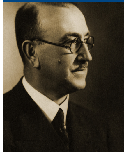
Кимон Георгиев (1882-1969)

1946 на контролиран от комунистите референдум монархията е премахната. По това време семейството на царя вече е напуснало страната. Няколко месеца по-късно демократите в България осъзнават, че комунистите не искат да делят властта, а я искат изцяло за себе си. Другите лидери като председателят на БЗНС