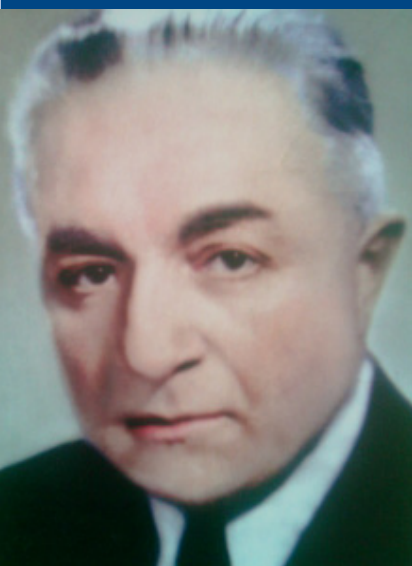
Никола Петков, осъден на смърт и обесен.