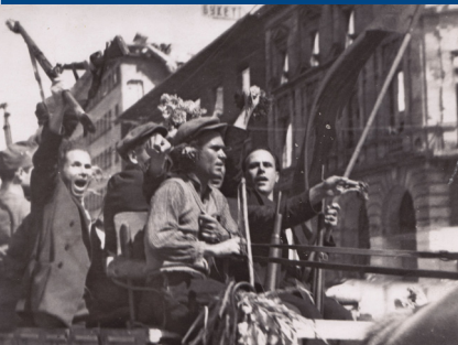
Снимки от 9 септември 1944 г.