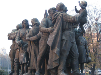
Пропагандни скулптурни композиции на паметника на Съветската армия в София