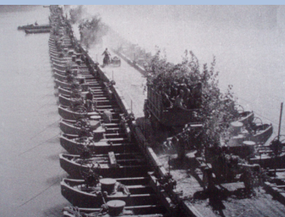
Войските на 3-ти Украински фронт навлизат на територията на България през понтонен мост на река Дунав на 8 септември 1944 г.

Едновременно с това от 13 до 22 септември 17-та въздушна армия се пребазира на летищата около София, Пловдив и Лом.