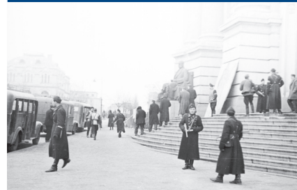
Снимка направена пред главния вход на Софийски университет, където заседава народният съд