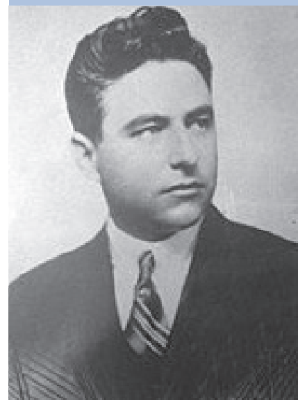
Константин Муравиев (1893-1965)