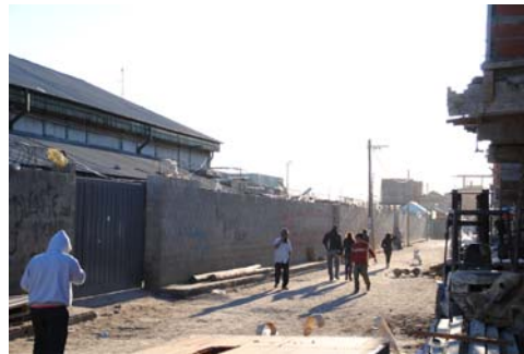
Bewohner der Villa 31

In den 1970er Jahren entwickelte sich Kolumbien zum größten Kokain- und Heroinproduzenten Lateinamerikas und lieferte die Drogen vor allem in die Vereinigten Staaten. Große Macht erlangten die Drogenkartelle von Medellín und Cali. Kolumbiens Regierung handelte. 1999 trat der Plan Colombia in Kraft. Innerhalb von sechs Jahren sollte er den Anbau und die Produktion von Drogen im Land um 50 Prozent senken. Dafür wurde das Militär autorisiert polizeiliche Funktionen zu übernehmen. Die Vereinigten Staaten unterstützten den Plan und erhofften sich einen Rückgang des Transports kolumbianischer Drogen ins eigene Land. Kolumbien, das von Drogenhandel und Guerilla-Kampf gebeutelt war, sollte befriedet werden.