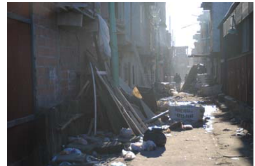
Villa 31 in Retiro, Buenos Aires

19 Galan, Nadia, „La familia narco argentina que creció al estilo 'Breaking Bad' en Rosario“, La Nación , 26.10.2013, http://www.perfil.com/policia/La-familia-narco-argentina-que-crecio-al-estilo-Breaking-Bad-en-Rosario-20131026-0024.html , [14.02.2014].