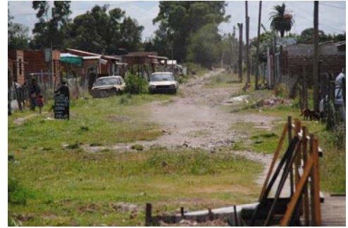
Elendsviertel in Monte Grande, Großraum Buenos Aires

Wird ein Drogendelikt aufgedeckt, werden entweder die soldaditos oder die vendedores herangezogen. Die „empresarios“ (Unternehmer) steuern und regeln den Drogenhandel. Sie bleiben im meist Hintergrund und engagieren erfahrene Anwälte und Buchhalter, um den Gewinn des lukrativen Geschäfts in Immobilien, Hotels, Restaurants und Autohäusern anzulegen. 33 Auch die Polizei ist in das illegale Geschäft verstrickt. Für 1.500 Peso (rund 140 Euro) schließen Polizisten ihre Augen vor der Realität. 34