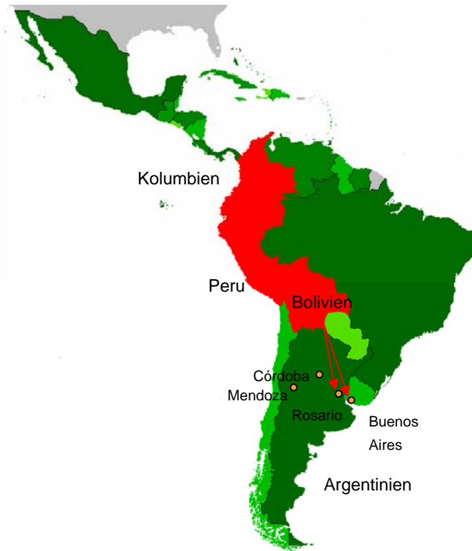
Karte 1: Transportwege der Drogen