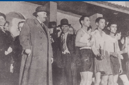
Георги Димитров и с млади спортисти, участници в пропагандната спротно проява „Щафета на младостта“

По този закон от университета са уволнени едни от най-известните български учени. Някои от тях са свързани с (бившия) политически елит и са съдени, а някои и екзекутирани от Народния съд. Но сред уволнените са и хора, които нямат никаква политическа обвързаност – общо те са 25.