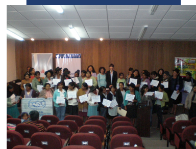
La coordinadora del PPI con las participantes del taller sobre derechos fundamentales de la mujer indígena en Sucre