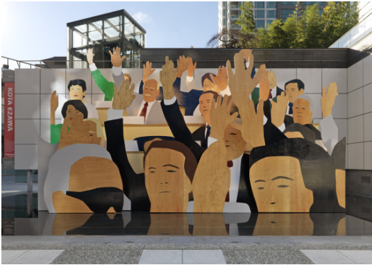
Kota Ezawa 「Hand Vote」 2012