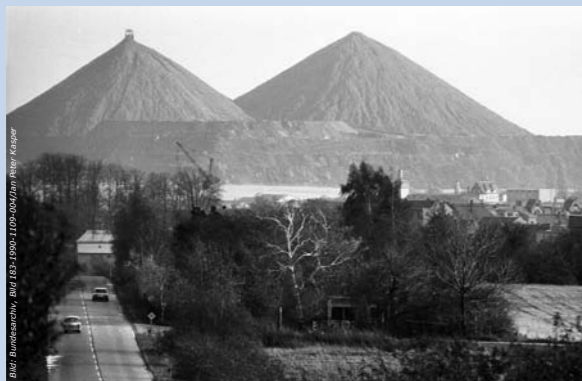
Riesige Abraumhalden – entstanden durch Jahrzehntelangen Uranbergbau in Thüringen und Sachsen.

Ungeklärtes, schadstoffbelastetes Wasser aus der Bitterfelder Chemieregion floss über die Elbe in die Bundesrepublik Deutschland, wodurch man auch dort auf den Umweltskandal in der DDR aufmerksam wurde. 23 Tonnen Quecksilber, 380 Tonnen Kupfer, 120 Tonnen Blei, 2000 Tonnen Zink und 3,5 Millionen Tonnen Chlorid nahm die Elbe pro Jahr auf.