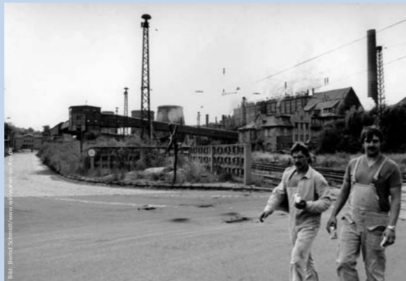
Arbeiter vor einer Kokerei in Bitterfeld. Ihr Kommentar: „Wird Zeit, dass die Dreckschleuder zu gemacht wird.“

Quelle: Hannsjörg F. Buck, Das Ausmaß der Umweltbelastung und Umweltzerstörung beim Untergang der DDR 1989/90 , in: Eberhard Kuhrt (Hrsg.), Die wirtschaftliche und ökologische Situation der DDR in den 80er-Jahren , Opladen 1996.