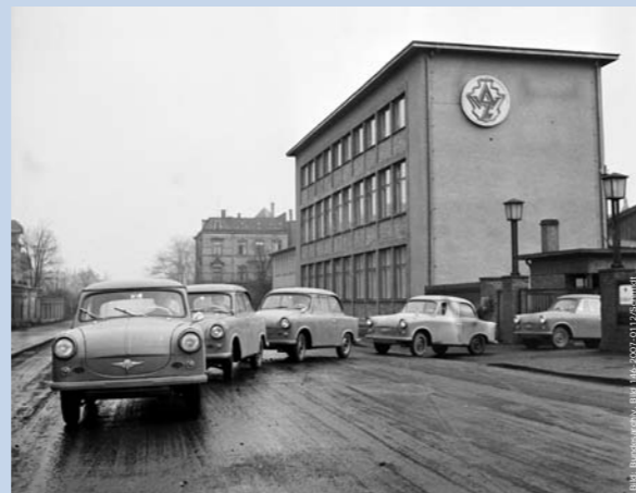
Der Trabant – Erzeugnis des VEB Automobilwerk AWZ Zwickau.

Dabei hatte sich sehr schnell gezeigt, dass mit der sozialistischen Gleichheitsideologie auch eine deutliche Einschränkung der persönlichen Freiheit verbunden ist. Menschen, die sich nicht in der gewünschten Form am Aufbau des Sozialismus beteiligen konnten oder wollten, mussten in der DDR mit Sanktionen oder hohen Strafen rechnen.