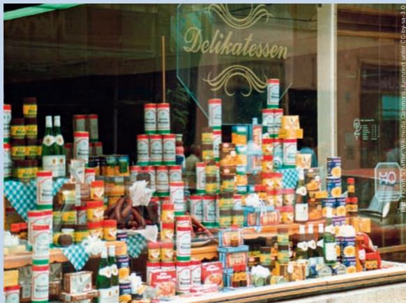
Die Geschäftsansage eines Delikat-Ladens: Südfrüchte wie Ananas waren in der DDR Mangelware.

Für Funktionäre von Partei und Staat gab es Sonderverkaufsstellen, in denen auch Westwaren zu billigen Ostpreisen angeboten wurden. Für die „normale“ Bevölkerung öffneten Ende der 1960er Jahre Geschäfte wie „Delikat“ (Lebensmittel) und „Exquisit“ (Textilien und Schuhe), in denen man Mangelwaren zu sehr hohen Ostpreisen anbot. Erst 1974 gab die SED-Führung nach und legalisierte für die DDR-Bevölkerung das Einkufen in den „Intershops“, die ursprünglich für durchreisende Ausländer gedacht waren.