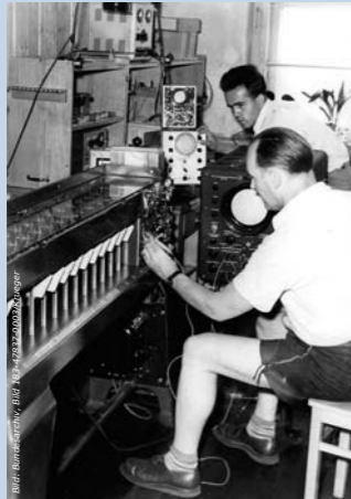
Häufig wurde in den DDR-Fabriken mit veralteten Maschinen gearbeitet.

Kennzeichen der sozialistischen Volkswirtschaft waren die volkseigenen Betriebe (VEB), die nach Enteignungen entstanden waren. Bis Mitte des Jahres 1948 wurden über 9.000 gewerbliche Unternehmen enteignet, die sich nun in Volkseigentum befanden und der Kontrolle der Staats- und Parteiführung unterlagen. Hinter der Idee der Konzentration und Zentralisierung stand der Gedanke, dass Großbetriebe leistungsfähiger seien als kleine und mittlere Betriebe. Darüber hinaus erhoffte sich die Partei- und Wirtschaftsführung Erleichterungen bei der Wirtschaftslenkung.