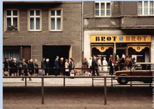
Berlin (Ost) 1984: Schlange vor einem Brotladen in der Schönhauser Allee.

Individualität, Religiosität, Selbstverwirklichung und Unternehmergeist waren im Sozialismus wenig bzw. nicht gefragt. Durch weitgehende Abschaffung des Eigentums und durch gleichmäßige Verteilung der vorhandenen Güter sollte eine soziale Gleichheit hergestellt werden. Allerdings musste der zu verteilende „Reichtum“ zuvor erwirtschaftet werden. Da aber das in der Natur des Menschen liegende Erfolgsstreben ideologisch als Habgier verteufelt wurde und nicht als positive Triebkraft für die Herstellung von Gütern in der DDR genutzt werden konnte, gab es schnell Engpässe.