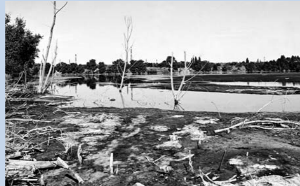
Durch Einleitung von Abwässern verschmutztes Ufer des Silbersees.