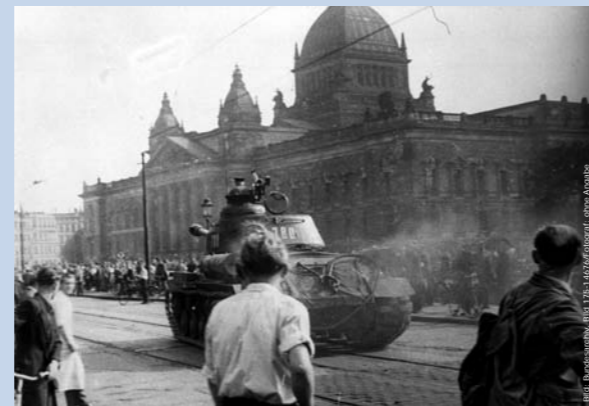
Sowjetischer Panzer in Leipzig am 17. Juni 1953.

Als der Generaldirektor des Kombinates Carl Zeiss Jena am 12. September 1988 auf der Leipziger Herbstmesse medienwirksam das erste Muster eines 1-Megabit-Speichers an Erich Honecker überreichte, sollte die Welt glauben, dass die DDR auch in den 1980er Jahren den ihr zugeschriebenen Platz unter den zehn ersten Industrienationen behauptet hätte. In Wirklichkeit gelang es trotz Milliardeninvestitionen nicht, den Rückstand der DDR auf dem Feld der Mikroelektronik aufzuholen.