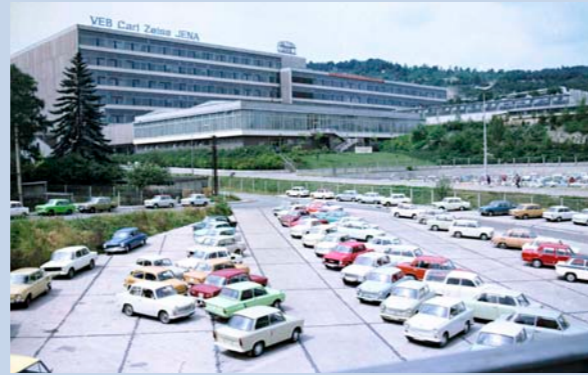
VEB Carl Zeiss Jena.