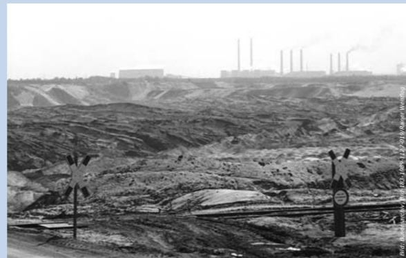
Die Landschaft wurde durch Braunkohleabbau zerstört.

Fehlender Gewinnreiz und eine Abschottung gegenüber den westlichen Märkten verursachten einen suboptimalen Einsatz knapper Ressourcen, behinderten Innovation und verhinderten den Einsatz am Weltmarkt vorhandener bestmöglicher Technologie.