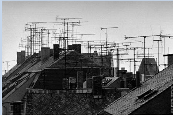
Das DDR-Fernsehen wurde zensuriert und kontrolliert, viele DDR-Bürger schauten deshalb Westfernsehen.

Kinder und Jugendliche in der DDR sollten in der Schule zu einem sozialistischen Typus eines „neuen Menschen“ erzogen werden, der in der Arbeit und in kollektiver Freizeitgestaltung seine Erfüllung findet. Außerdem versuchte das SED-Regime, durch die frühzeitige Eingliederung der jungen Menschen in Massenorganisationen, wie die Thälmannpioniere und die Freie Deutsche Jugend (FDJ), einen Teil der Freizeit der Kinder und Jugendlichen unter Kontrolle der Partei zu bekommen und für eine systematische ideologische Beeinflussung zu nutzen.