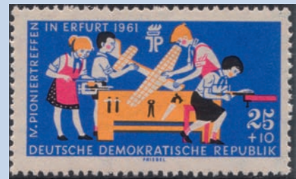
Briefmarke Pioniere beim Flugmodellbau.