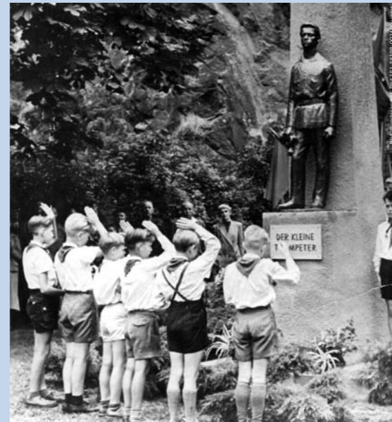
Thälmpioniere beim Gruß vor einem Denkmal in Halle.

Die Pionierkleidung bestand aus einer weißen Bluse und dem dunklen Rock für Mädchen; aus einem weißen Hemd und dunkler Hose für Jungen, dem Pionierhalstuch und dem dunkelblauen Käppi mit dem Pionierabzeichen. Diese Kleidung trugen die Kinder bei Pionierveranstaltungen, an Fest- und Feiertagen der DDR und zu besonderen Anlässen (s. Bild oben rechts). Das bekannteste FDJ-Symbol war das blaue Hemd bzw. die blaue Bluse mit einem Sonnenemblem auf dem linken Ärmel.