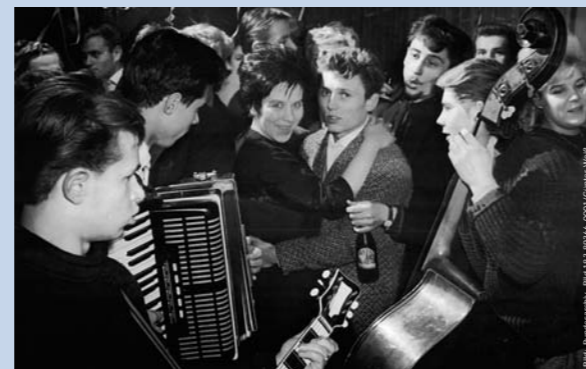
Silvester in einem Berliner Jugendklub.

Walter Ulbricht am 18. Dezember 1965 auf dem 11. Plenum des Zentralkomitees der SED.