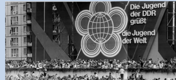
X. Weltfestspiele der Jugend und Studenten 1973.

Mit den X. Weltfestspielen der Jugend und Studenten 1973 in Ost-Berlin wollte die DDR-Führung ihre angebliche Weltoffenheit demonstrieren. In Wirklichkeit verfeinerte sie lediglich die Unterdrückungsmechanismen, um sie nach außen hin weniger sichtbar werden zu lassen. Gerade in Vorbereitung des Jugendfestivals wurden tausende nichtangepasste Jugendliche verhaftet und in Heime der Jugendhilfe oder in psychiatrische Einrichtungen eingewiesen bzw. mit Aufenthaltsbeschränkungen belegt.