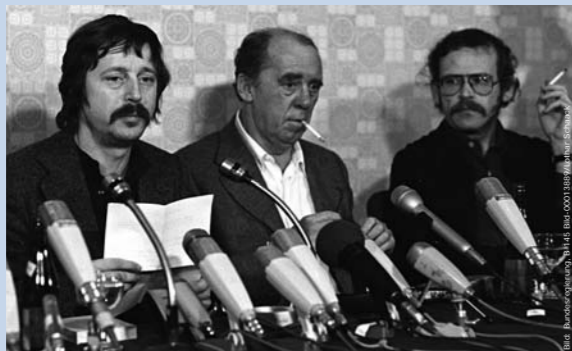
Der Liedermacher Wolf Biermann (links) gibt bei einer Pressekonferenz eine Stellungnahme zu seiner Ausbürgerung aus der DDR ab. Rechts neben Biermann sitzen der Schriftsteller Heinrich Böll und der Journalist Günter Wallraff.

Nach der am 16. November 1976 erfolgten Zwangsausbürgerung des Musikers und Lyrikers Wolf Biermann etablierte sich in der DDR eine neue, Bevölkerungsgruppen übergreifende Oppositionsbewegung, die in den folgenden Jahren rasant anwuchs. Die Ziele der Oppositionsgruppen waren sehr unterschiedlich, viele organisierten sich unter dem Schutz der Kirchen in der DDR. Für die Friedliche Revolution im Herbst 1989, das Ende des SED-Regimes und die Wiederherstellung der staatlichen Einheit Deutschlands war diese Entwicklung von großer Bedeutung.