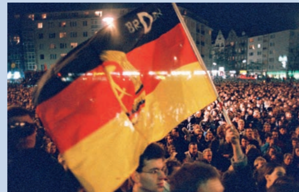
November 1989: Friedliche Revolution in Berlin.

Aktive Freizeit in der Familie war fast nur an freien Tagen möglich, sonst waren die meisten DDR-Bürger vom Aufstehen bis zum Schlafengehen eingespannt. Sämtliche Bereiche des kulturellen Lebens wurden durch die SED kontrolliert und überwacht. Bis zum Bau der Mauer am 13. August 1961 hatten deshalb viele freiheitlich gesinnte Intellektuelle und Künstler die DDR bereits verlassen.