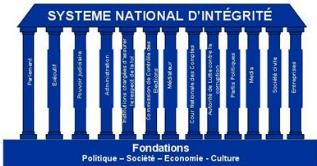
Schéma 1: Piliers du Système National d'Intégrité