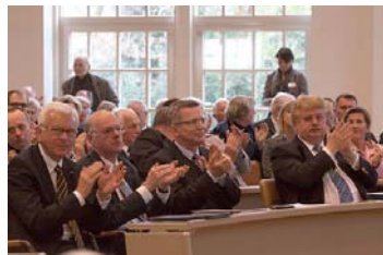
Symposium für Kai-Uwe von Hassel

Mit einem Symposium hat die Hauptabteilung WD/ACDP der Konrad Adenauer-Stiftung den 100. Geburtstag von Kai-Uwe von Hassel gewürdigt. Als Ministerpräsident, Bundesminister und Präsident des Deutschen Bundestages gehörte von Hassel zu den herausragenden politischen Persönlichkeiten der Bundesrepublik. >Link