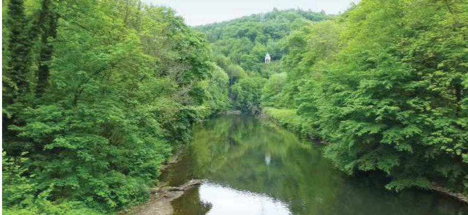
Abb. 2: Wald an der Wupper in Remscheid