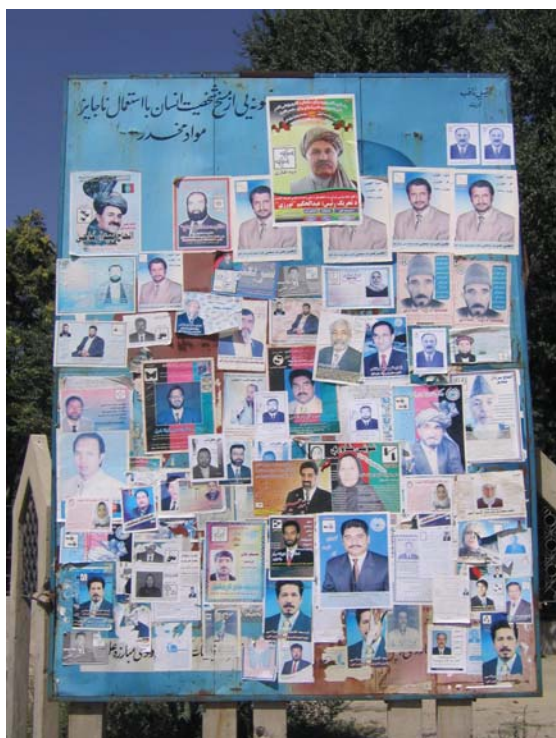
Plakatflut an der Sarake Wazir Akbar Khan

Wie auch immer, die Kandidaten, die zur Disqualifizierung anstehen, werden am Wahltag auf Plakaten die Wände der rund 26.500 Wahlstationen säumen, um das Ausmaß ungültiger Stimmen so gering wie möglich zu halten. Gewählt wird am 18. September von 6:00 Uhr bis 16:00 Uhr. Seit dem Ausbruch des afghanischen Wahlkampfes am 17. August 2005 in den 34 Provinzen sind bislang mehr als 10 Kandidaten getötet worden und in fast allen Provinzen außerhalb von Kabul werden Frauen von Kriegsfürsten, Drogenbaronen und Mitgliedern der Taliban durch permanente Drohungen und Gewalt an der Teilnahme an dem politischen Prozess systematisch behindert. „Die Kandidatinnen in Afghanistan stellen sich gegen die Tali-