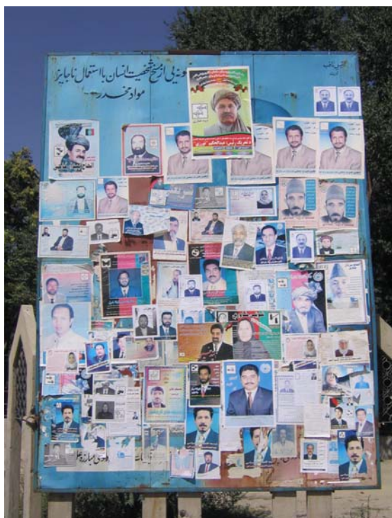
Plakatflut an der Sarake Wazir Akbar Khan

Wie auch immer, die Kandidaten, die zur Disqualifizierung anstehen, werden am Wahltag auf Plakaten die Wände der rund 26.500 Wahlstationen säumen, um das Ausmaß ungültiger Stimmen so gering wie möglich zu halten. Gewählt wird am 18. September von 6:00 Uhr bis 16:00 Uhr. Seit dem Ausbruch des afghanischen Wahlkampfes am 17. August 2005 in den 34 Provinzen sind bislang mehr als 10 Kandidaten getötet worden und in fast allen Provinzen außerhalb von Kabul werden Frauen von Kriegsfürsten, Drogenbaronen und Mitgliedern der Taliban durch permanente Drohungen und Gewalt an der Teilnahme an dem politischen Prozess systematisch behindert. „Die Kandidatinnen in Afghanistan stellen sich gegen die Tali-