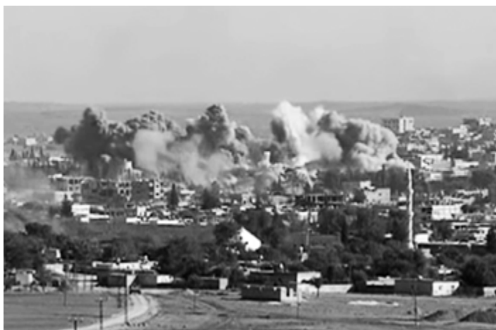
Angriff der Anti-IS-Koalition auf Kobani: Der Rückschlag bewegte den IS, andere Ziele anzugreifen.