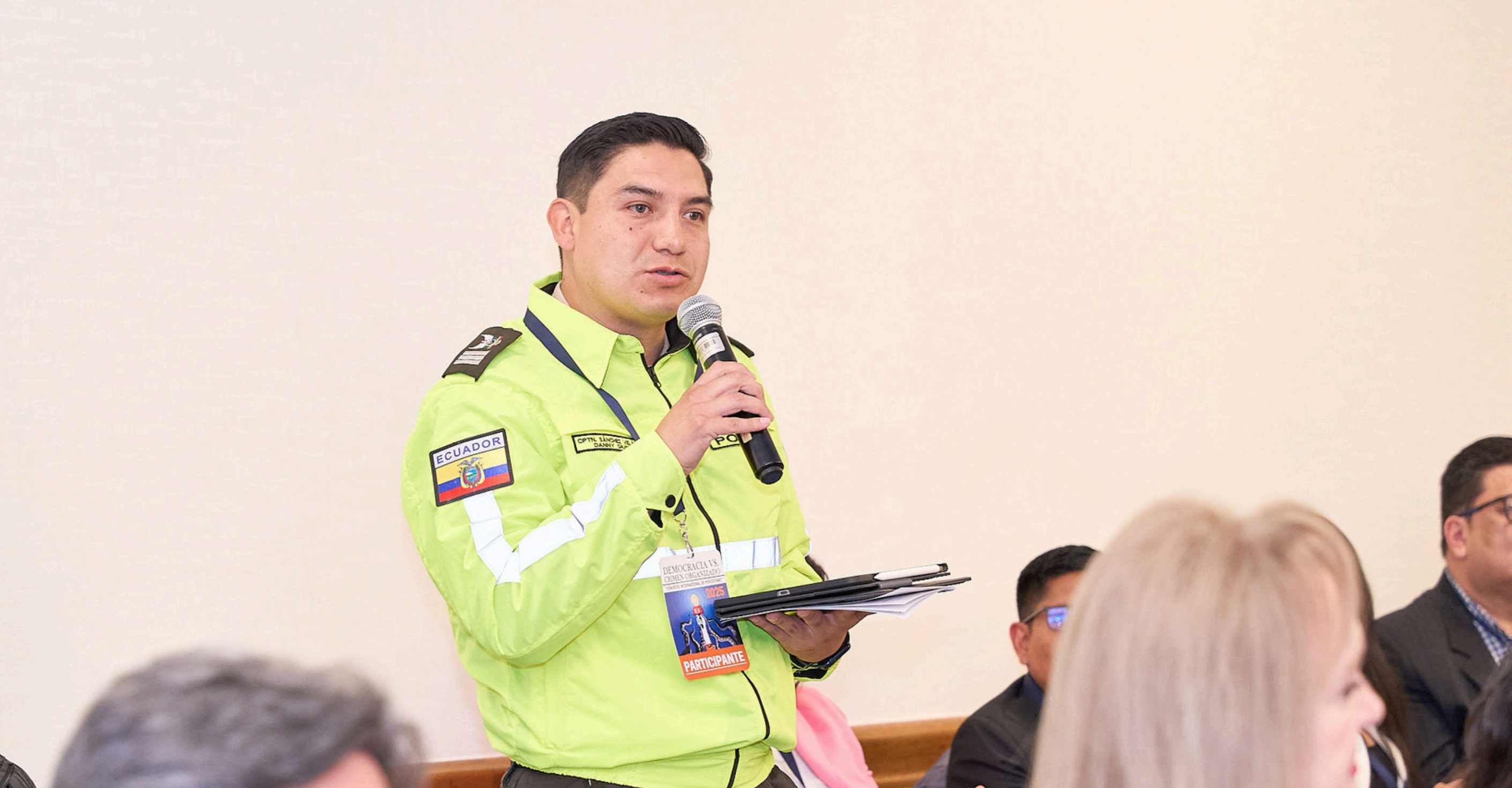
Participantes de las jornadas en Quito.