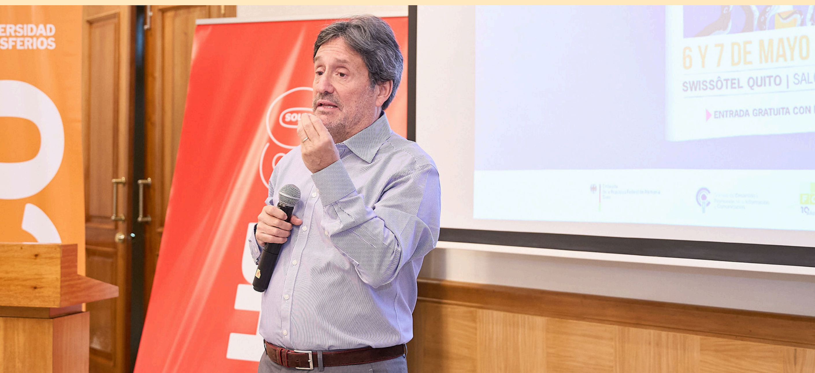
Francisco Santos, exvicepresidente de Colombia.