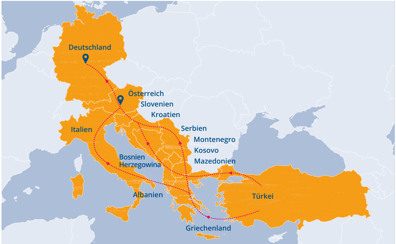
Abbildung 2: Balkanroute

verdeutlichen, wie sehr die strikte Überprüfung von Flüchtlingen aus Bürgerkriegsregionen eine wichtige Voraussetzung für eine erfolgreiche präventive Terrorismusbekämpfung ist. Die gilt im österreichischen Fall nicht nur für Tschetschenien, sondern auch für den Kosovo, Nordmazedonien und Bosnien, aus denen im Verhältnis zur Bevölkerungszahl besonders viele Dschihadisten und Dschihadistinnen nach Syrien gezogen sind, von denen wiederum viele Beziehungen zu Gleichgesinnten aus und in Österreich unterhalten.