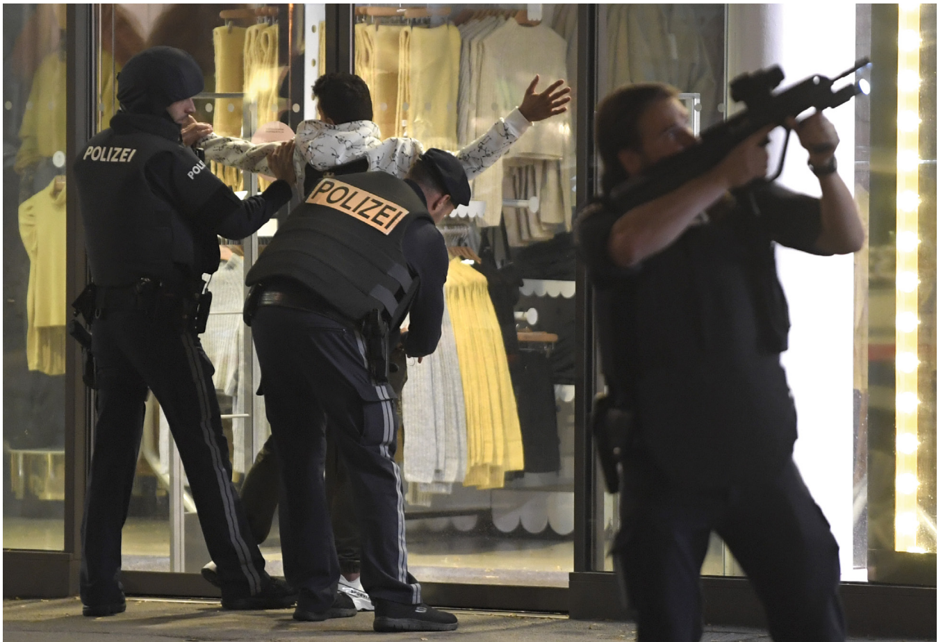
Polizisten im Einsatz nach dem Terroranschlag in Wien am 2. November 2020

Mit einem Sturmgewehr und einer Pistole bewaffnet war er durch ein Ausgeviertel in der Wiener Innenstadt gestreift und hatte vier Menschen getötet und 23 verletzt, bevor er selbst von der Polizei erschossen wurde. Das Geschehen verdeutlichte einem breiteren Publikum erstmals, wie gefährlich der österreichische islamistische Terrorismus ist. Tschetschenische, bosnische, (ethnisch-)albanische und türkische Extremisten haben gemeinsam mit wenigen österreichischen Konvertiten eine starke Szene aufgebaut, die sich ab 2012 mit einem großen Kontingent von Kämpfern am Krieg in Syrien beteiligte. Infolge der militärischen Niederlage des Islamischen Staats (IS) im Jahr 2019 verlagerte sich das Geschehen teils wieder in das Heimatland. Dort sind die Dschihadisten und Dschihadistinnen heute zwar schwächer als vor einigen Jahren, aber ihr Milieu ist jünger, transnationaler und unberechenbarer geworden.