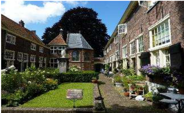
Stadt der idyllischen Hofjes: Leiden

Zu den besonders schönen Beispielen der niederländischen Renaissance zählen das Rathaus, das Gemeindehaus der Deichgenossenschaft und die Stadtwage. Schlusspunkt der Stadtführung ist der prächtige ehemalige Sitz der Tuchmachergilde, die Tuchhalle „De Lakenhal“.