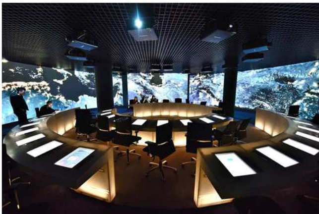
Im Parlamentarium Brüssel