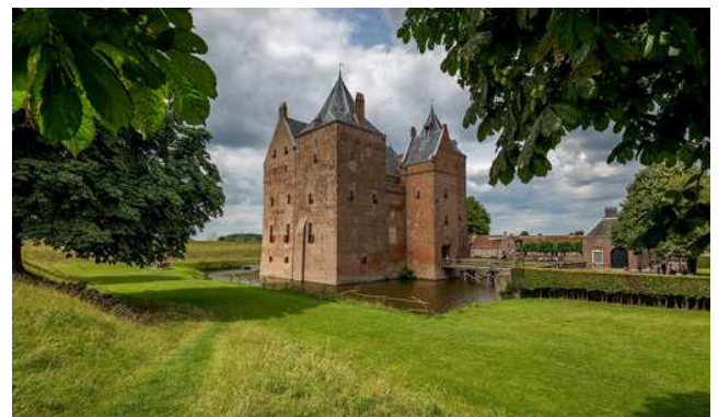
Die Wasserburg Schloss Loevestein

Abendessen und Übernachtung in Rotterdam.