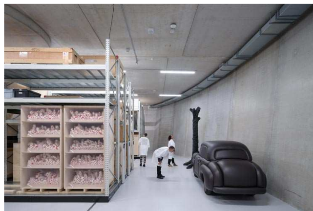
Depot Boijmans Van Beuningen

Wichtiger Hinweis: Die Reise wird durch den Freundeskreis der Konrad-Adenauer-Stiftung fotografisch begleitet. Wir behalten uns vor, die Fotos für Zwecke der Presse- und Öffentlichkeitsarbeit zu nutzen.