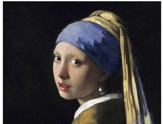
Ausschnitt „Mädchen mit dem Perlenohrring“, J. Vermeer. Mauritshuis.

Abendessen und Übernachtung in Rotterdam.