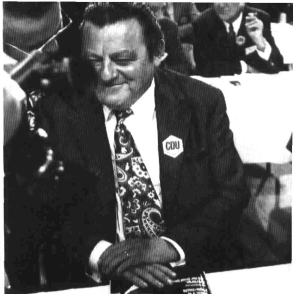
△ Viel Beifall erhielt der CSU-Vorsitzende Franz-Josef Strauß