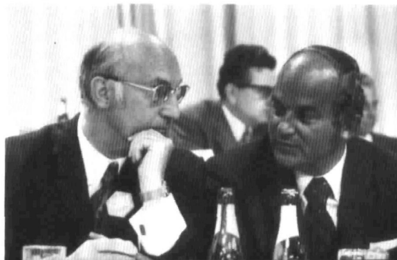
Hans Katzer mit Dr. Rainer Barzel ▷