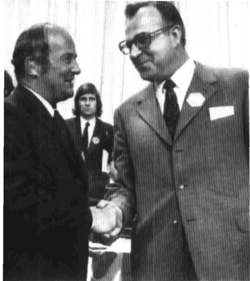
△ Helmut Kohl gratuliert dem Fraktionsvorsitzenden zu seinem Sieg