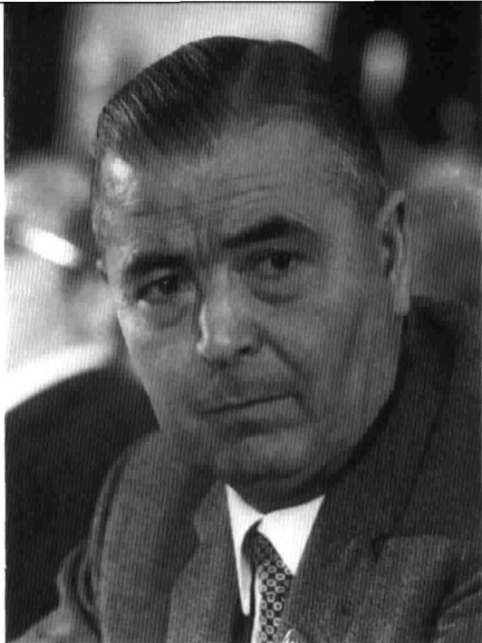
Die beiden Ehrenvorsitzenden Prof. Ludwig Erhard und Dr. h. c. Kurt Georg Kiesinger