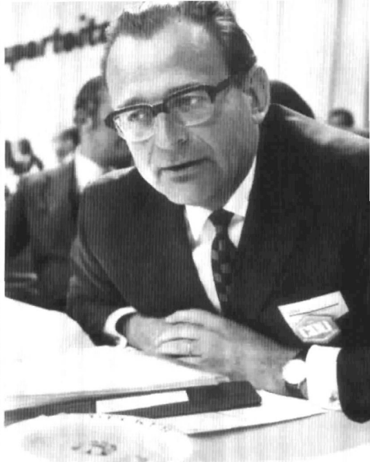
△ Der neue Generalsekretär der CDU, Dr. Konrad Kraske