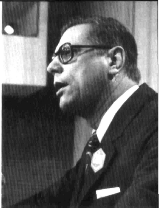
△ Der Berliner Landesvorsitzende Peter Lorenz während eines Diskussionsbeitrages