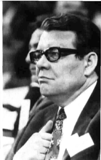
△ Heinrich Köppler, Vorsitzender des Präsidiums von Nordrhein-Westfalen wurde mit überzeugender Mehrheit den Bundesvorstand gewählt