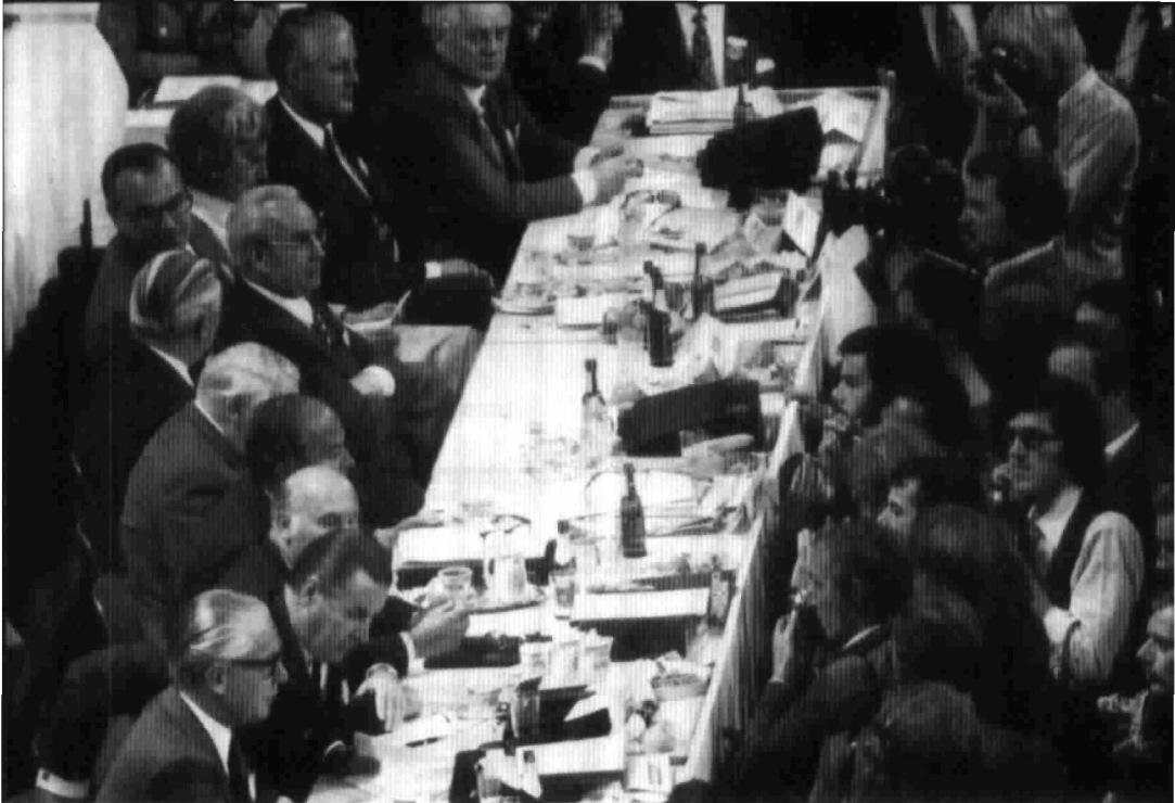
△ Der Präsidiumstisch war stets von Fotografen umlagert