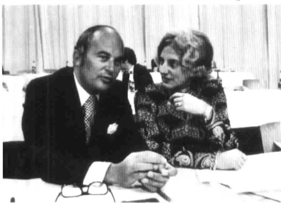
◁ Dr. Helga Wex wurde als stellvertretende Bundesvorsitzende der CDU bestätigt