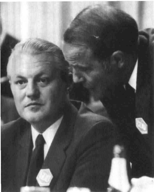
△ Dr. Alfred Dregger im Gespräch mit Ministerpräsident Dr. Gerhard Stoltenberg