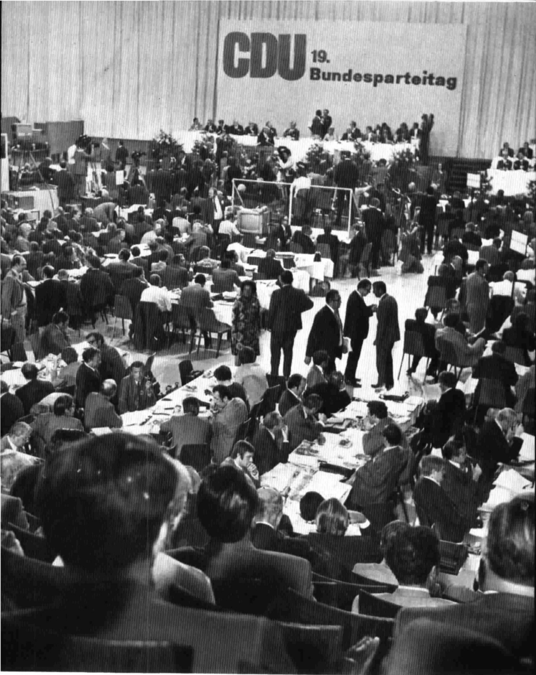
Blick von der Tribüne in den Plenarsaal