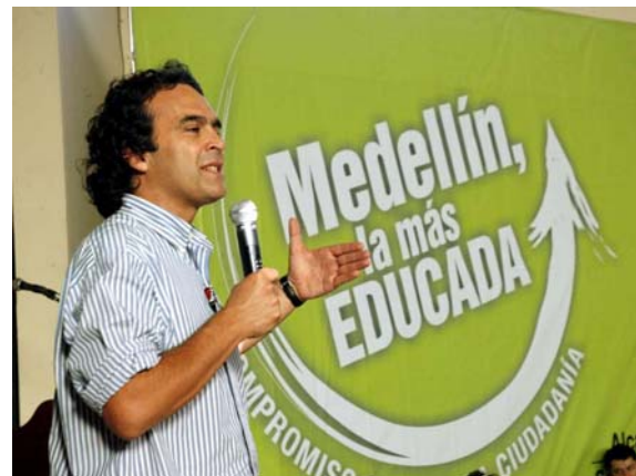
Sergio Fajardo, Alcalde de Medellín.