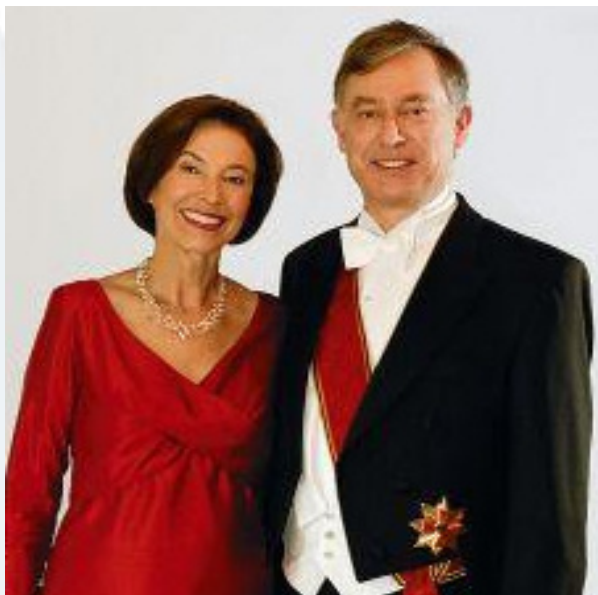
Presidente Horst Köhler y su esposa Eva Luise Köhler.

El 25 de mayo de 1971 Gustav Heinemann pisó, como último presidente alemán, suelo colombiano, con ocasión de una visita oficial de estado. Treinta y seis años después Horst Köhler viene a renovar esas huellas. El Presidente en ejercicio y su esposa llegarán el 12 de marzo y permanecerán en Bogotá por tres días.