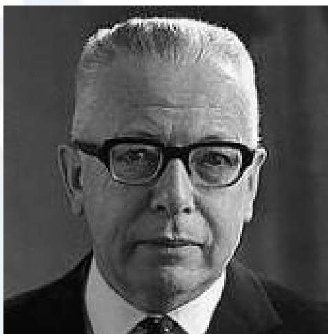
Ex-Presidente Gustav Heinemann

Treinta y seis años atrás, cuando el entonces presidente de Alemania Occidental, Gustav Heinemann , visitó a su contraparte colombiano, Misael Pastrana Borrero , eran otros los temas que estaban a la