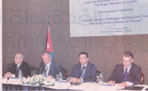
مندوب رئيس الوزراء خلال افتتاح فعاليات المؤتمر امس (پترا)

ويهدف المؤتمر الذي يستمر يومين بمشاركة خبراء عرب واجانب إلى مناقشة لتحديات الدولية التي تواجه النمو الاقتصادي والمخاطر التي تهدد البيئة والطاقة والتعليم وصولاً إلى تشكيل حلول استراتيجية للعالم العربي في هذا المجال.