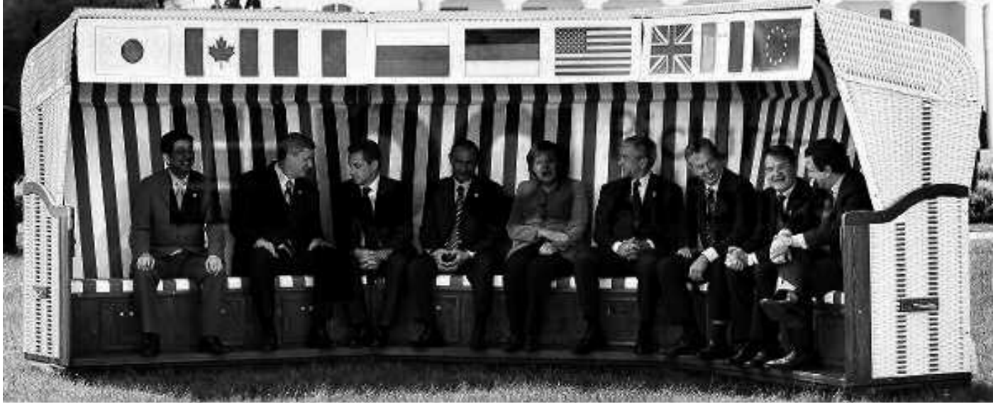
G8-Gipfeltreffen unter deutschem Vorsitz, Heiligendamm im Juni 2007.

Fragen der Wirtschaftsordnung sowie der Sozial- und Umweltpolitik stellen sich in diesen Staaten aufgrund des raschen wirtschaftlichen Wachstums ungleich dringlicher. Entscheidende Herausforderungen der Globalisierung, mit denen die westlichen Industriestaaten ebenfalls in aller Konsequenz konfrontiert sind, werden sich in den nächsten Jahrzehnten vor allem in den Entwicklungs- und Schwellenländern zeigen. Hinsichtlich ihres Einflusses auf die Entwicklung des Globalisierungsprozesses haben die Schwellenländer die traditionellen Akteure einer globalen Wirtschafts- und Ordnungspolitik in manchen Teilbereichen sogar schon übertroffen. Ihr Anteil an ökologischen und sozialen Problemen mit globaler Auswirkung sowie ihre Bedeutung für eine regionale politische und sicherheitspolitische Stabilität hat zugenommen. Dabei spielen auch die unterschiedlichen demographischen Entwicklungen in den jeweiligen Staaten-gruppen eine wichtige Rolle.