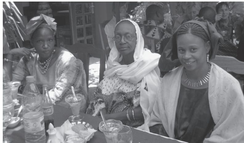
Vertreterinnen von Partnerorganisationen aus Guinea und Mali bei einem internationalen Workshop der KAS Dakar zur Verbesserung der Bildungssituation von Mädchen und jungen Frauen in Afrika, Gorée im April 2007.

Gleichzeitig muss sich die KAS im Bereich der Entwicklungszusammenarbeit mit neuen internationalen Tendenzen, Methoden und Instrumenten auseinandersetzen. Hierzu gehören vor allem die multilaterale (in Abgrenzung zur bilateralen) Zusammenarbeit, die Budget- und Korbfinanzierungen (als Ergebnis des G8-Gipfels in Gleneagles 2005) und die Geberharmonisierung (entsprechend der UN-Konferenz in Monterrey 2002 und der Paris-Deklaration von 2005). Im Hinblick auf diese neuen Herausforderungen spielen Demokratieförderung und Werteorientierung eine besonders wichtige Rolle, denn die neuen entwicklungspolitischen Strategien zielen – zumindest im Prinzip – auf mehr Eigenverantwortung der Partner ab. Wenn die Partner der Entwicklungszusammenarbeit – Partnerorganisationen, -parteien und gegebenenfalls auch -regierungen – nicht eigenverantwortlich nach demokratischen Prinzipien handeln und nicht den gleichen