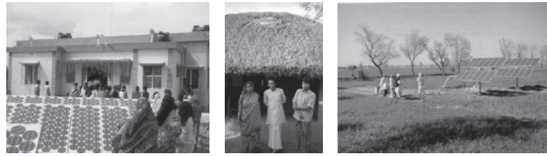
Dass Entwicklungs- und Schwellenländer das Potenzial erneuerbarer Energien erkannt haben und dieses zunehmend auszuschöpfen wollen, verdeutlichten Experten aus Indien, Brasilien und dem Senegal bei einer Konferenz der Konrad-Adenauer-Stiftung und des New Yorker EastWest Institutes, Brüssel im Februar 2007.

Die Versorgung mit Ressourcen spielt eine zentrale Rolle sowohl für das Überleben vieler Menschen in den Entwicklungs- und Schwellenländern als auch für die Aufrechterhaltung des Lebensstandards in Deutschland und Europa. Die Sicherung von Rohstoffen und Transitwegen ist von strategischer Bedeutung. Aufgrund des transnationalen Charakters der Ressourcensicherung ist die entsprechende Versorgung nicht mehr nur ein Thema der Wirtschafts- und Umweltpolitik, sondern erhält zunehmend eine außen-