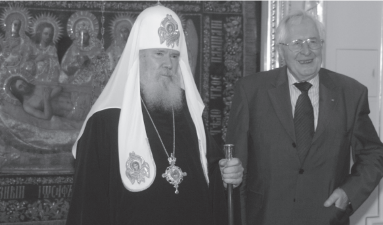
Patriarch Alexej II. empfängt den Vorsitzenden der Konrad-Adenauer-Stiftung, Prof. Dr. Bernhard Vogel, Moskau im Mai 2007.

Für die KAS sind diese Grundwerte unverzichtbar mit dem freiheitlichen, demokratischen Rechtsstaat verknüpft und in seine konstitutionelle Grundordnung eingebunden. Zwar verlangen diese Grundwerte bereits aus sich heraus nach einem solchen Rechtsstaat und führen zu ihm hin, aber sie setzen ihn nicht bereits voraus. Einerseits bedürfen sie des Schutzes durch den Staat; andererseits stehen sie auch über dem Staat, der auf sie angewiesen bleibt, um immer wiederkehrende Interessengegensätze auszugleichen. Da wir an der Ausgestaltung dieses Spannungsverhältnisses mitwirken wollen, kann und muss ein Dialog über diese Grundwerte insbesondere auch mit weltanschaulich anders orientierten und selbst mit autoritär verfassten Systemen geführt werden.