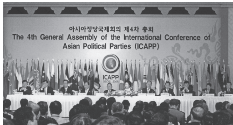
Delegierte der 4. „International Conference of Asian Political Parties“, Seoul im September 2006. Für die Gründung der ICAPP hatte die KAS zusammen mit der Hanns-Seidel-Stiftung die „Patenschaft“ übernommen.

Im Zusammenhang mit Maßnahmen der allgemeinen Demokratieförderung ist die Förderung von demokratischen Parteien ein Schwerpunkt der internationalen Zusammenarbeit der Konrad-Adenauer-Stiftung. Wir sind davon überzeugt, dass eine adäquate Repräsentation gesellschaftlicher Interessen und eine aktive Partizipation der Bürger an der Gestaltung ihres Gemeinwesens nur durch Parteienvielfalt, Wahlfreiheit und demokratische Parteienkonkurrenz zu erreichen sind. Andererseits kooperieren wir aber keineswegs mit jeder Partei und nicht um jeden Preis. Die KAS