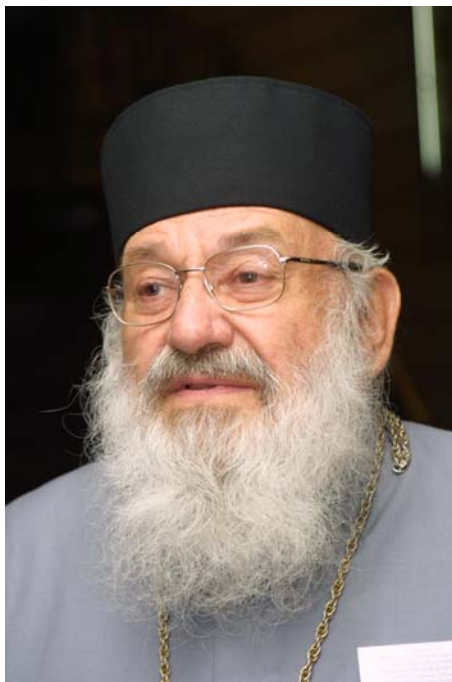
Любомир (Гузар), Верховний Архієпископ Української Греко-Католицької Церкви, Кардинал:

” Впродовж історії людства ми мали різні форми приватної власності, дуже різні форми врядування. Досвід вчить нас, що найкраща, найбільш відповідна для нас та людської гідності є та форма врядування, яка називається демократія. Але вона водночас є і найтруднішою, бо вона вимагає від кожного громадянина знання, зацікавлення ситуацією своєю і інших, ініціативності, відповідальності і дуже поважного розуміння, що таке свобода. Одним словом, властиво демократом може бути тільки зріла людина, свідомо своєї власної гідності, своєї відповідальності. З цього походить те, що є більшість людей краще себе почувають у системі врядування, у якій не мусять ані думати, ані брати на себе відповідальність. Одним словом, люди люблять, щоб ними керували, і тому дуже легко піддаються різного роду демагогам, які знову ж, у свою чергу, користуються цим, і до певної міри справедливо користуються, бо як хтось хоче бути рабом, то нехай буде рабом.