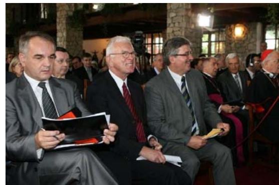
Waldemar Pawlak, Prof. Hans-Gert Pöttering, Bronisław Komorowski