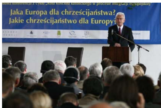
Prof. Dr. Hans Gert Pöttering, Präsident des Europäischen Parlaments