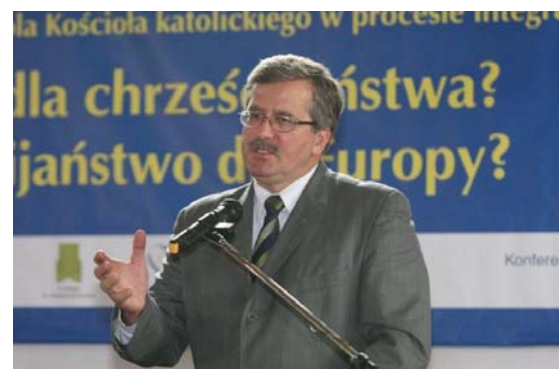
Bronisław Komorowski, Präsident des Polnischen Sejms