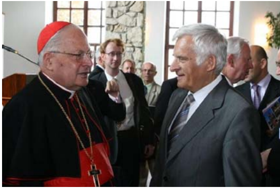
Kardinal Dr. Angelo Sodano Sodano, Prof. Jerzy Buzek, MdPE