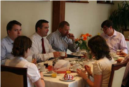
Letzte Arbeitsbesprechung vor dem Start