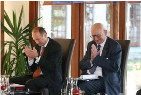
Prof. Władysław Bartoszewski, Staatssekretär in der Kanzlei des Premierministers Othmar Karas, MdEP, Vizepräsident der EVP-ED-Fraktion im Europäischen Parlament