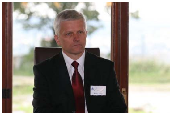
Andrzej Grzyb, Vorsitzender des Ausschusses für Europäische Angelegenheiten im Polnischen Sejm, PSL