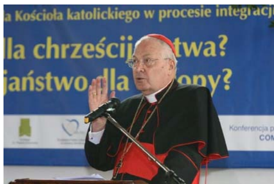
Dr. Angelo Kardinal Sodano, Dekan des Kardinalskollegiums, Kardinalstaatssekretär a.D