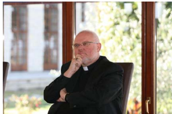
Erzbischof Prof. Dr. Reinhard Marx