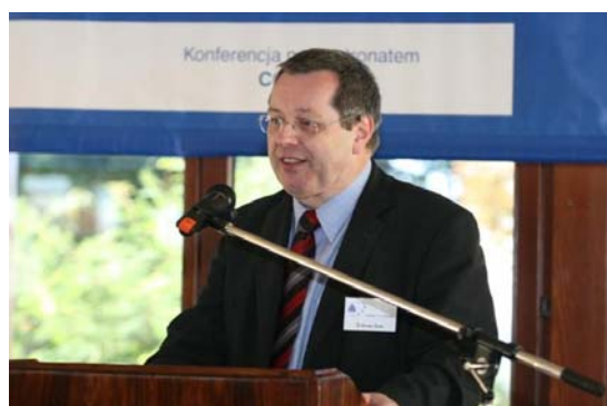
Dr. Stephan Eisel, Mitglied des Bundestages, CDU