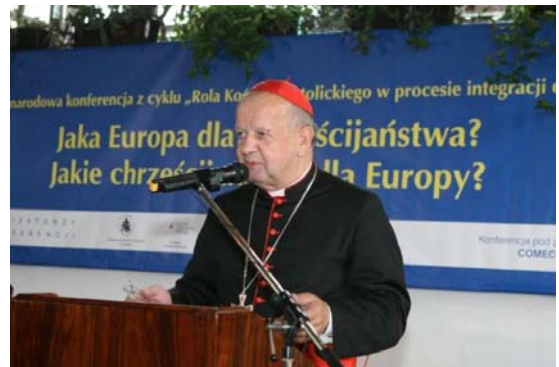
Kardinal Dr. Stanisław Dziwisz, Erzbischof von Krakau