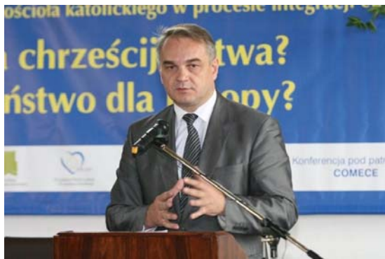
Waldemar Pawlak, stellv. Premierminister von Polen