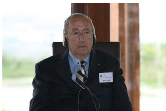
Michel Eddé, Libanesischer Kultur- und Hochschulminister a.D.