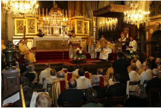
Empfang auf Einladung des Marschalls der Wojewodschaft Kleinpolen, Marek Nawara