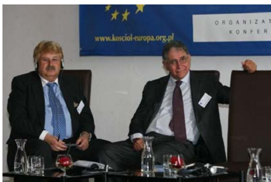
Elmar Brok, MdPE Prof. Dr. Rocco Buttiglione, Vizepräsident des Italienischen Parlaments