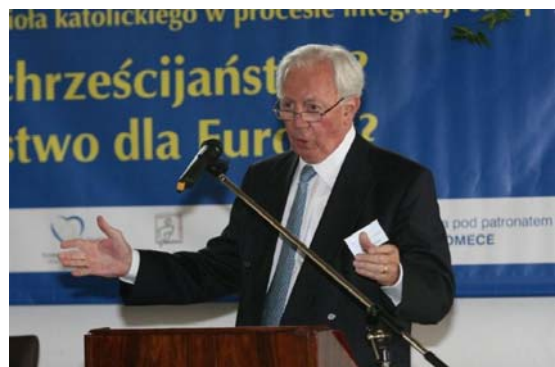
Präsident der Robert-Schuman-Stiftung Luxemburg, EU-Kommissionspräsident a.D.