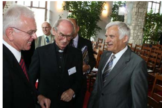
Prof. Hans-Gerd Pöttering, Erzbischof Alfons Nossol, Prof. Jerzy Buzek